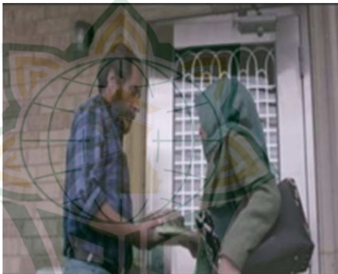
Gambar 4.13 Berperilaku Baik Terhadap Tetangga

Islam menekankan agar umat saling berkasih sayang, kepada diri sendiri, suami atau istri, anak-anaknya, orang tua, dan sesama. Kasih sayang juga ditujukan makhluk ciptaan Allah Swt.