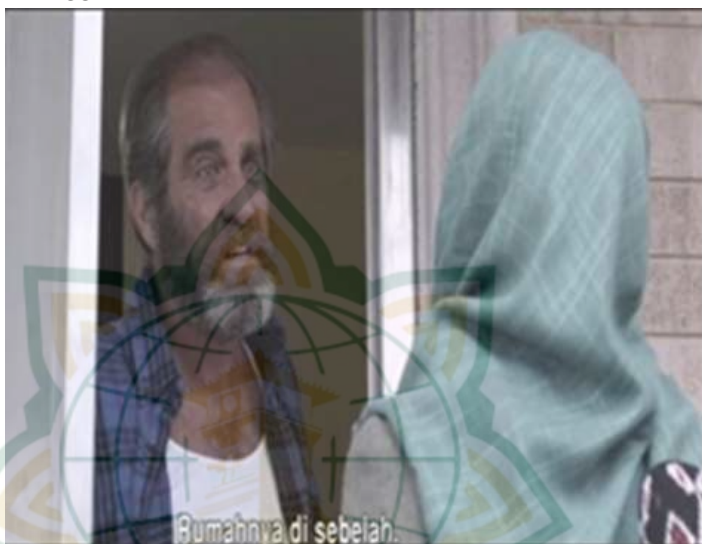
Gambar 4.14 Bersikap Sabar

kedudukan tetangga bagi seorang muslim, Islam pun memerintahkan ummatnya untuk berbuat baik terhadap tetangga.