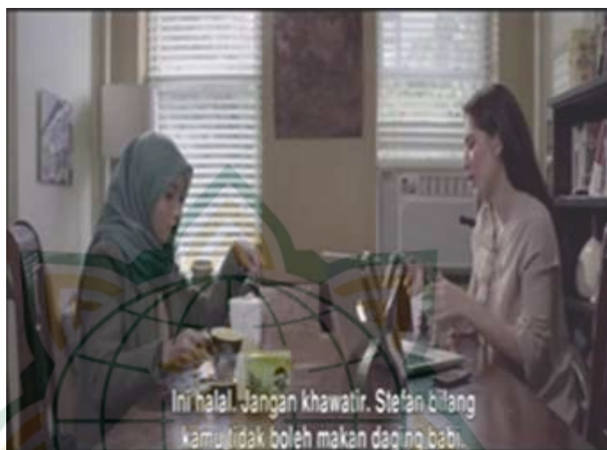
Gambar 4.15 Toleransi Antar Umat Beragama

lisan dari menggunjing serta menahan semua anggota tubuh dari perbuatan yang dilarang oleh Allah Swt. 19