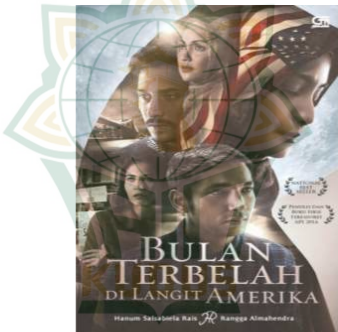
Gambar 4.1 Poster Film “Bulan Terbelah di Langit Amerika” 1

Bulan Terbelah di Langit Amerika merupakan sebuah film Indonesia tahun 2015 yang diproduksi Max Pictures dan Falcon Pictures. Namun pada 2018, kelanjutan film ini pun dirilis dengan judul Bulan Terbelah di Langit Amerika 2, film ini mendapat rating