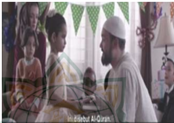
Gambar 4.12 Menyayangi Anak Kecil

Pesan dakwah yang terkandung dalam scene 00.18.35-00.16.52 mengajarkan kepada kita untuk senantiasa menyayangi anak kecil. Rasulullah SAW telah memberikan teladan tentang kasih sayang kepada anak-anak. Bahkan, Rasulullah dijuluki sebagai bapak para anak yatim. 16 Banyak kisah yang menggambarkan kecintaan beliau kepada anak-anak, salah satunya yaitu Rasulullah selalu menghibur dan menggembirakan hati anak-anak. Bila datang seseorang membawa bingkisan berupa buah-buahan, maka yang pertama diberinya adalah anak-anak kecil.