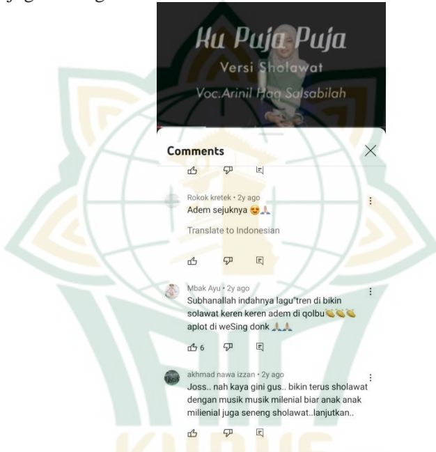
Gambar 4.3. Komentar Positif di Youtube Mas Owdy

Begitu juga respon orang-orang yang yang mengomentari di akun youtube Mas Owdy, mereka mengungkapkan bahwa lagu sholawat yang dibawakan oleh Mas Owdy sangat keren adem di qolbu, dan salah satu dari mereka menyarankan untuk terus membuat sholawat dengan musik milenial agar anak milenial juga seneng sholawat.