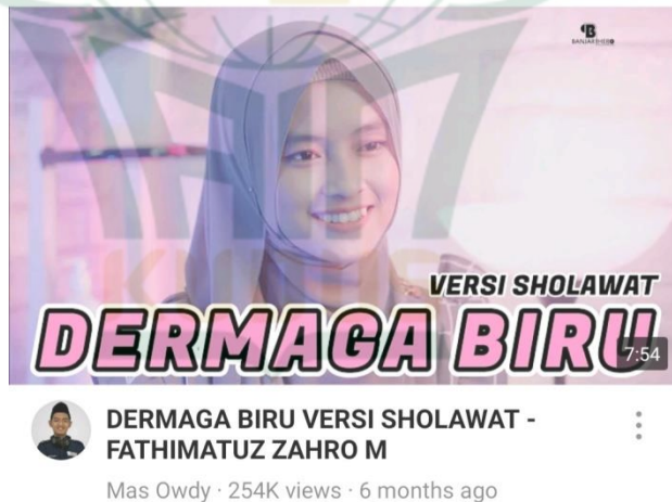
Gambar 4.4. Contoh Gubahan Lagu Sholawat

Ada beberapa lagu yang digubah Mas Owdy, diantaranya seperti lagu pertama yang dimodifikasi adalah lagu dari Toto Ario yang berjudul "Pecah Seribu" liriknya diganti menjadi lantunan "Birosulillahi Wal Badawi", adapun yang kedua adalah lagu dari Tama Halu yang berjudul "Joko Tingkir" menjadi shalawat "Sholatullah Salamulloh" dan lagu dari Emen yang berjudul "Dermaga Biru" menjadi shalawat "Innal Habibal Musthofa" dan masih banyak lainnya. Tentunya hal ini diupayakan untuk memupuk minat masyarakat terhadap musik religi sholawat.