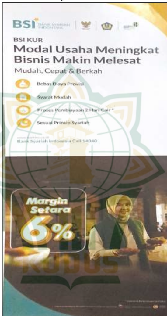
Gambar 4.2 Brosur Pembiayaan KUR BSI KCP Demak