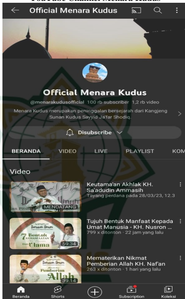
Gambar 4.2 YouTube Channel Menara Kudus

3