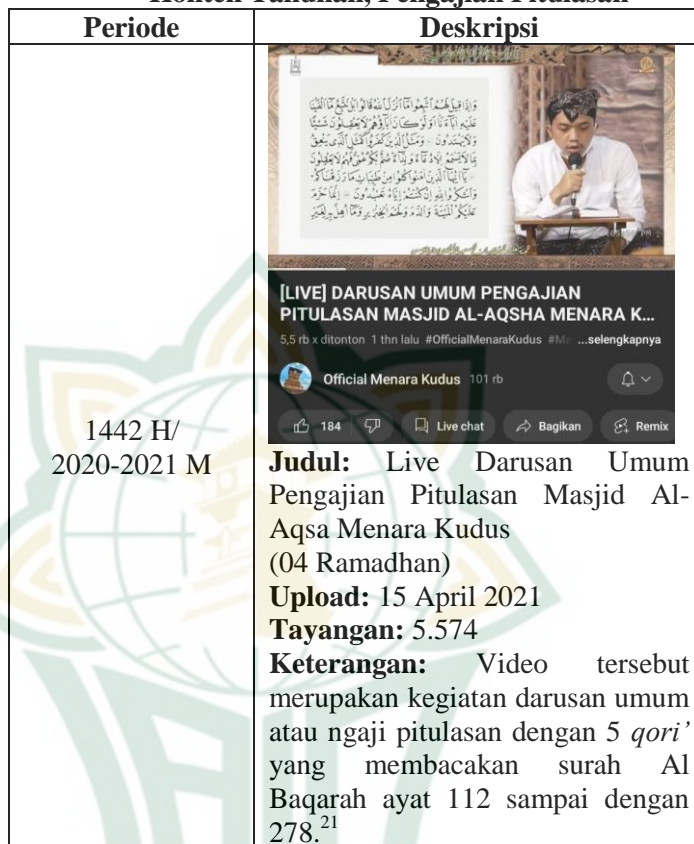
Tabel 4.3 Konten Tahunan, Pengajian Pitulasan