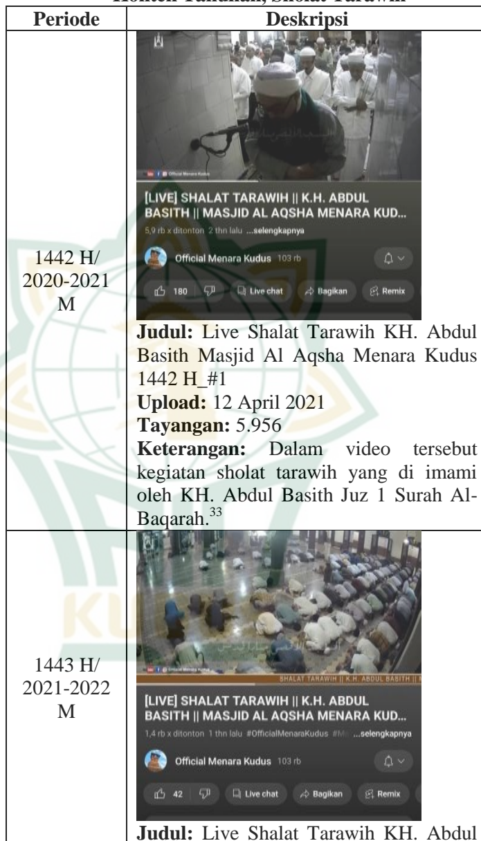
Tabel 4.7 Konten Tahunan, Sholat Tarawih