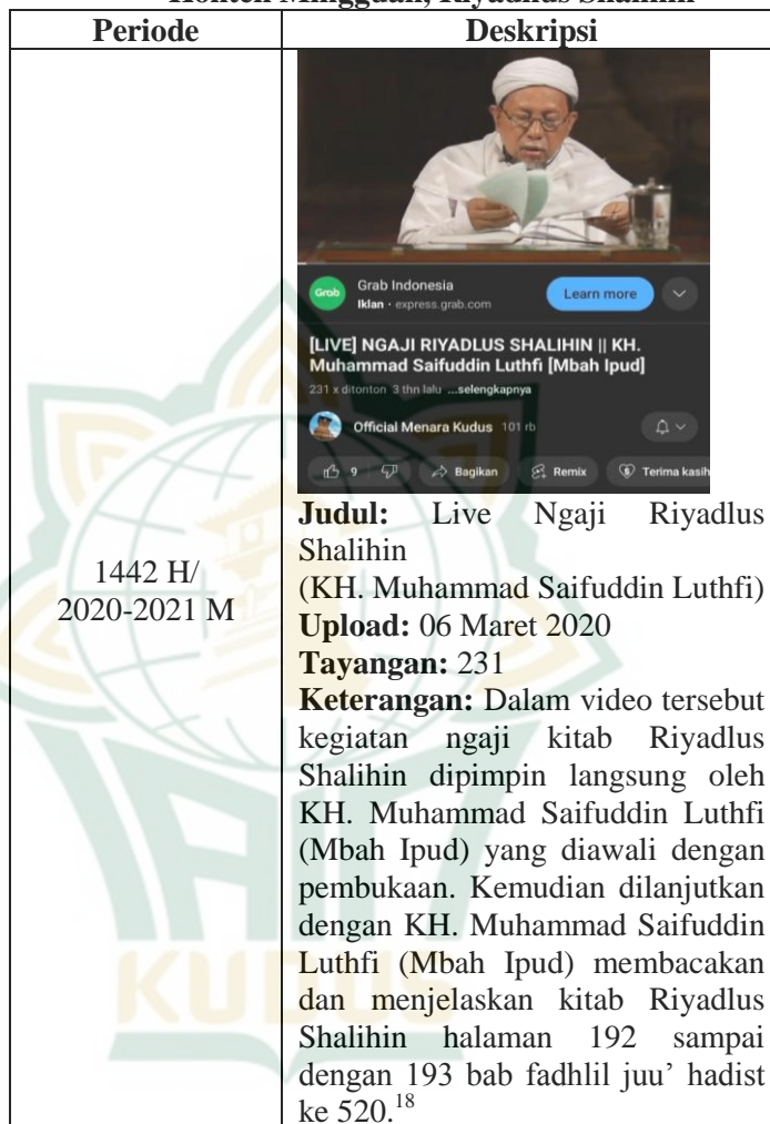
Tabel 4.2 Konten Mingguan, Riyadlus Shalihin