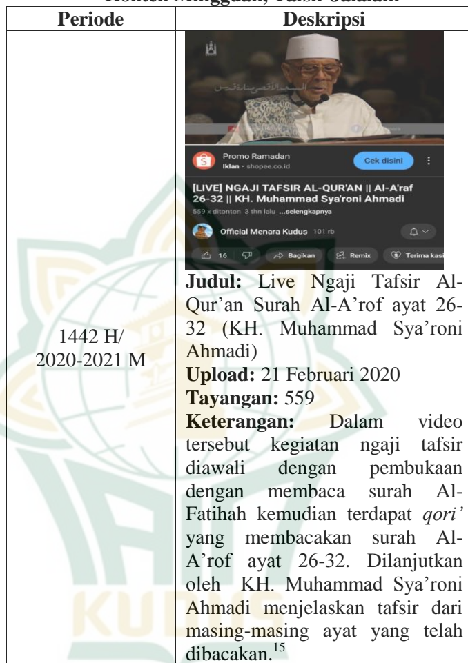
Tabel 4.1 Konten Mingguan, Tafsir Jalalain