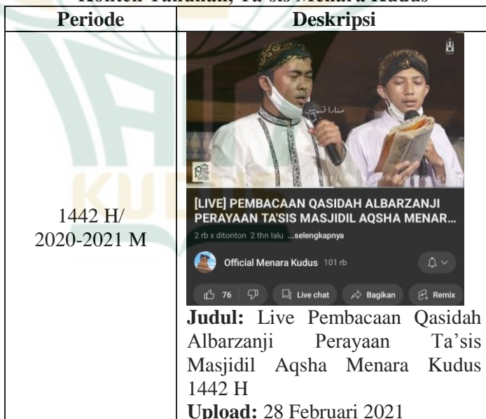
Tabel 4.4 Konten Tahunan, Ta'sis Menara Kudus