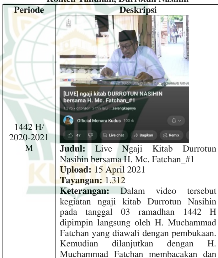
Tabel 4.6 Konten Tahunan, Durrotun Nashihin