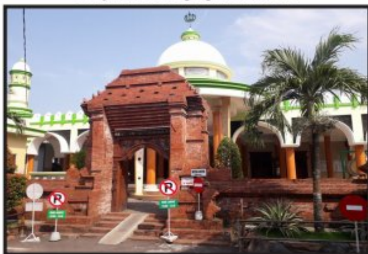
Gambar. 5 Masjid An-Noor Nganguk Wali Kudus

Nganguk Wali ini pembangunannya searah waktu pembangunan masjid kuno-kuno Jawa di awal pembangunannya. Abad ke 15 dan Abad ke-16 merupakan fase-fase banyak berdirinya masjid-masjid di Jawa pasca keruntuhan Kerajaan Majapahit. Meskipun tidak diketahui secara seksama pembangunan Masjid An-Noor Nganguk Wali Kudus, namun masjid ini berhugungan erat dengan Kyai Telingsing, seorang Cina Muslim teman dari Kanjeng Sunan Kudus. Masjid An-Noor Nganguk Wali Kudus sudah tercatat secara administratif pada website Direktorat Urusan Agama Islam dan Pembinaan Syariah Direktorat Jenderal Bimbingan Masyarakat Islam Kementerian Agama Republik Indonesia dengan alamat virtual http://www.simas.kemenag.go.id/ pada Nomor Identitas Masjid: 01.4.14.19.02.000057 beralamat di Jl. Tanjung Nganguk wali Kramat Kota Kudus.