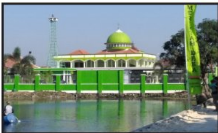
Gambar 1 Masjid Besar At-Taqwa Kecamatan Undaan

Kudus. Kondisi ini juga tampak dalam realitas keagamaan yang berkembang di Kecamatan Undaan. 39 masjid menjadi bagian penyebaran kegiatan-kegiatan keagamaan di masjid-masjid desa Se-Kecamatan Undaan. Masjid-masjid tersebut juga secara faktual telah tercatat di Kementerian Agama RI pada laman website Ditjend Bimas Islam, yaitu: http://www.simas.kemenag.go.id/ . Dalam data base ini juga tercatat satu masjid besar menjadi fasilitas keagamaan yang termasuk dalam cakupan administrasi keagamaan di Kecamatan Undaan.