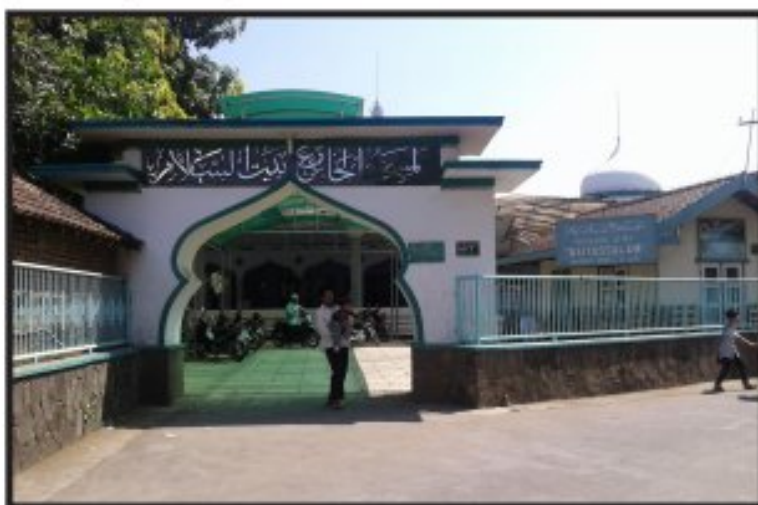
Gambar. 10 Masjid Bersejarah Baitussalam Kauman Jekulo Kudus

Masjid Baitussalam Kauman Jekulo secara administratif tercatat pada website Direktorat Urusan Agama Islam dan Pembinaan Syariah Direktorat Jenderal Bimbingan Masyarakat Islam Kementerian Agama Republik Indonesia dengan alamat virtual http://www.simas.kemenag.go.id/ pada Nomor Identitas Masjid: 01.4.14.19.06.000001 beralamat di Jekulo Kauman. Dalam perjalanan waktu, karena posisi masjid yang strategis berada di tempat pemukiman warga, maka intensitas kegiatan masjid ini sangat tampak nyata sampai detik ini.