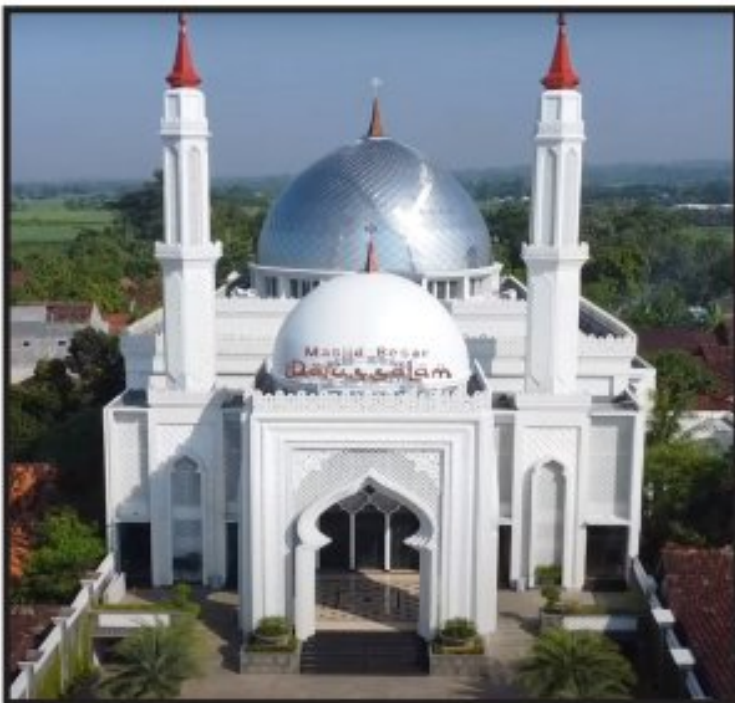
Gambar. 1 Masjid Besar Darussalam Kecamatan Gebog

Kota Kecamatan Gebog. Satu masjid besar yang tercatat di bawah administrasi Kecamatan Gebog adalah Masjid Besar Darussalam dengan ID Masjid Tercatat 01.3.14.19.08.000001 beralamat di Gondosari RT 05 RW 02 Gebog Kudus. Masjid ini dalam lingkup administrasi kewilayahan menjadi masjid kecamatan dan terhubung secara administratif kegiatan keagamaannya dengan Kecamatan Gebog sebagai atasan pemangku wilayahnya. Kehadiran masjid ini juga menjadi pelengkap administrasi kewilayahan dalam cakupan administrasi keagamaan Kecamatan Gebog.