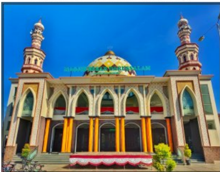
Gambar 1 Masjid Besar Darussalam Kecamatan Kaliwungu

Pertumbuhan wisata yang cukup tinggi dan aspek pengembangan Usaha Mikro Kecil Menengah (UMKM) di Kecamatan Kaliwungu, hal tersebut juga berjalan simetris dengan pertumbuhan keagamaan yang berkembang di dalamnya. 79 masjid berada di bawah administrasi kelembagaan Kecamatan Kaliwungu. Jumlah ini tertuang secara faktual dalam laman website Direktorat Urusan Agama Islam dan Pembinaan Syariah Direktorat Jenderal Bimbingan Masyarakat Islam Kementerian Agama Republik Indonesia dengan alamat virtual http://www.simas.kemenag.go.id/ . Dari 79 data masjid yang tercakup sistem informasi Kementerian Agama Republik Indonesia tersebut, salah satu masjid tercatat sebagai Masjid Besar Kecamatan Kaliwungu dengan nama Masjid Besar Darussalam yang terletak di Dukuh Jetak Desa Kedungdowo RT 05 RW 04 Kaliwungu Kudus pada status Nomor Identitas Masjid 01.3.14.19.01.000067.