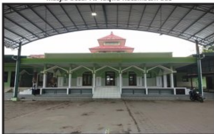
Gambar 1 Masjid Besar At-Taqwa Kecamatan Bae