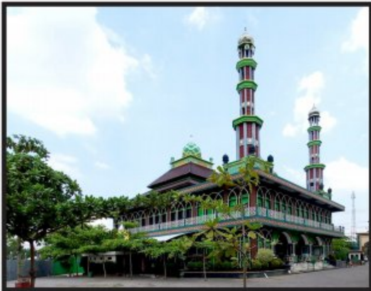
Masjid Besar Al-Munawwaroh Kecamatan Jekulo