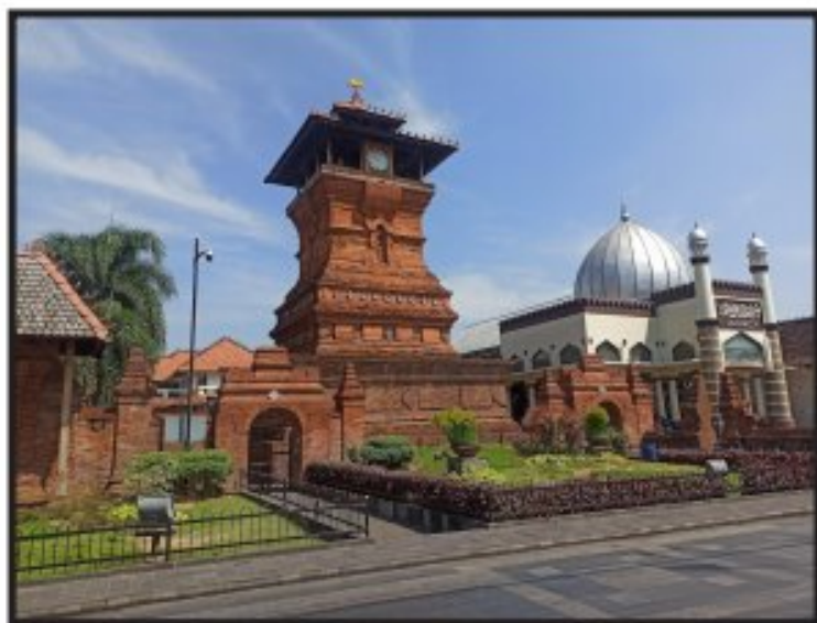
Gambar. 2 Masjid Menara (Al-Aqsha) Kota Kudus

keislaman masyarakatnya diapresiasi sepenuhnya oleh Lombard. Salah seorang ahli dari Perancis ini menjelaskan dalam karyanya bahwa Kota Kudus yang namanya mengacu kepada al-Quds (nama Arab untuk Yerusalem) merupakan kota keagamaan, kota suci, dan mempunyai masjid yang besar lagi indah. 7 Keindahan yang muncul dari Kota Kudus ini sampai saat ini masih lestari dan menjadi icon utama masyarakat Kabupaten Kudus. Penyebutan Kota Kudus dengan istilah al-Quds , kota suci sebagaimana disampaikan oleh Lombard terikat pula dengan guru-guru rohaniyah yang membantu penguasa-penguasa Demak dalam usaha mereka menyebarkan agama Islam. Sunan Kudus merupakan tokoh sentral pengembangan keagamaan masyarakat Kudus. Sunan Kudus bermukim di Kudus tepatnya di daerah Kauman dan mendirikan Masjid al-Aqsa atau Masjid al-Manar dan terkenal dengan nama Masjid Menara Kudus pada tahun 1549 M. Masjid ini berbentuk unik, karena memiliki menara yang serupa bangunan candi.