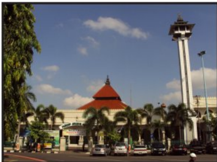
Gambar. 1 Masjid Agung Kota Kudus

Agung Kudus telah tercatat pada laman website Direktorat Urusan Agama Islam dan Pembinaan Syariah Direktorat Jenderal Bimbingan Masyarakat Islam Kementerian Agama Republik Indonesia dengan alamat virtual http://www.simas.kemenag.go.id/ . Masjid Agung Kudus tercatat secara administratif dengan Nomor Identitas Masjid 01.2.14.19.02.000020.