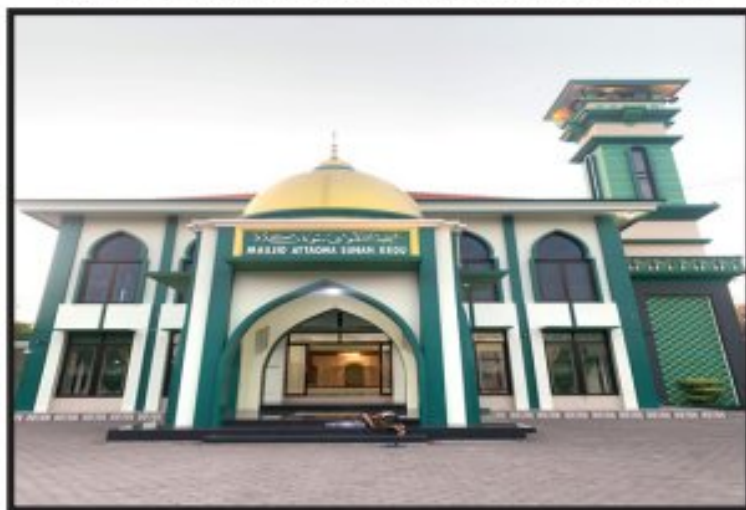
Gambar. 8 Masjid Bersejarah At-Taqwa (Sunan Kedu) Gribig Kudus

Sunan Kedu ini terkait dengan perjuangan Sunan Kedu atau yang lebih dikenal dengan nama Syeikh Abdul Bashir. Dari aspek kesejarahan Sunan Kedu tercatat sebagai pendatang ke Kota Kudus dan menjadi murid Kanjeng Sunan Kudus. Kedatangannya di Kota Kudus pada tahun 1576 Masehi dan menjadi salah satu murid Sunan Kudus. Dari forklor yang berjalan, Sunan Kedu tercatat pula menjadi prajurit tangguh di Kerajaan Demak Sunan Kedu meninggal pada 28 Februari 1612. 9 Secara administratif masjid ini tercatat dalam website Direktorat Urusan Agama Islam dan Pembinaan Syariah Direktorat Jenderal Bimbingan Masyarakat Islam Kementerian Agama Republik Indonesia dengan alamat virtual http://www.simas.kemenag.go.id/ pada Nomor Identitas Masjid: 014.14.19.08.000086 beralamat di Desa Gribig RT 04 RW 02 Gebog Kudus.