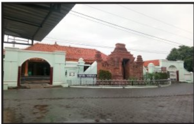
Gambar. 6 Masjid Wali Al-Makmur Jepang Kudus

Salah satu bangunan yang menjadi unsur kesatuan dari Masjid Wali adalah Gapura Padureksan. Menganalisis dari aspek genealogi arsitektur masjid, Masjid Wali Al-Ma'mur Desa Jepang tercatat berjalan dengan waktu berdirinya Masjid Menara Kudus, yakni Abad ke-16 pada Tahun 1589 M. Pendirian Masjid Wali Al-Makmur Jepang sangat lekat dengan ketokohan Adipati Haryo Jipang yang berasal dari daerah Jipang Panolan, Blora, murid kinasih Kanjeng Sunan Kudus. Masjid ini tercatat secara administratif pada website Direktorat Urusan Agama Islam dan Pembinaan Syariah Direktorat Jenderal Bimbingan Masyarakat Islam Kementerian Agama Republik Indonesia dengan alamat virtual http://www.simas.kemenag.go.id/ pada Nomor Identitas Masjid: 01.4.14.19.05.000039 beralamat di Jl. Suryokusumo Jepang Mejobo Kudus.