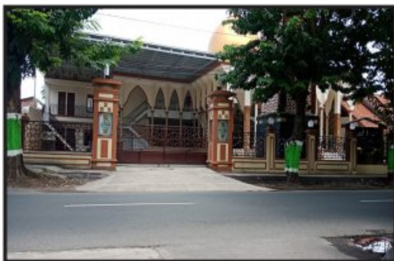
Gambar 1. Masjid Besar Al-Hamidiyah Kecamatan Kota