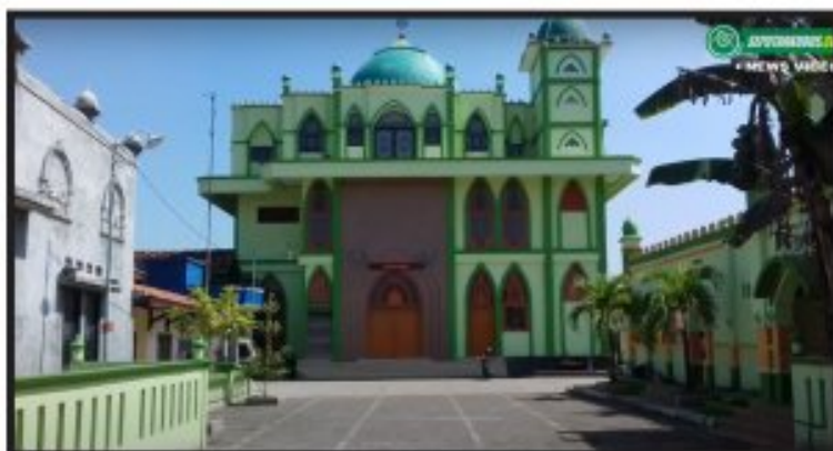
Gambar 1 Masjid Besar Al-Falah Kecamatan Jati

ketentuan administratif ketatanegaraan, Kecamatan Jati memiliki satu Masjid Besar yang berdekatan dengan Pusat Ibu Kota Kecamatan. Tercatat dalam data base Sistem Informasi Masjid Kementerian Agama RI, yakni pada situs http://www.simas.kemenag.go.id/ , Masjid Besar Al-Falah dengan ID Masjid 01.3.14.19.03.000066, yang beralamat di Jl. Patimura Desa Loram Wetan RT 05 RW 04 Jati Kudus, sebagai lembaga keagamaan kemasjidan di bawah koordinasi Pemerintah Kecamatan Jati.