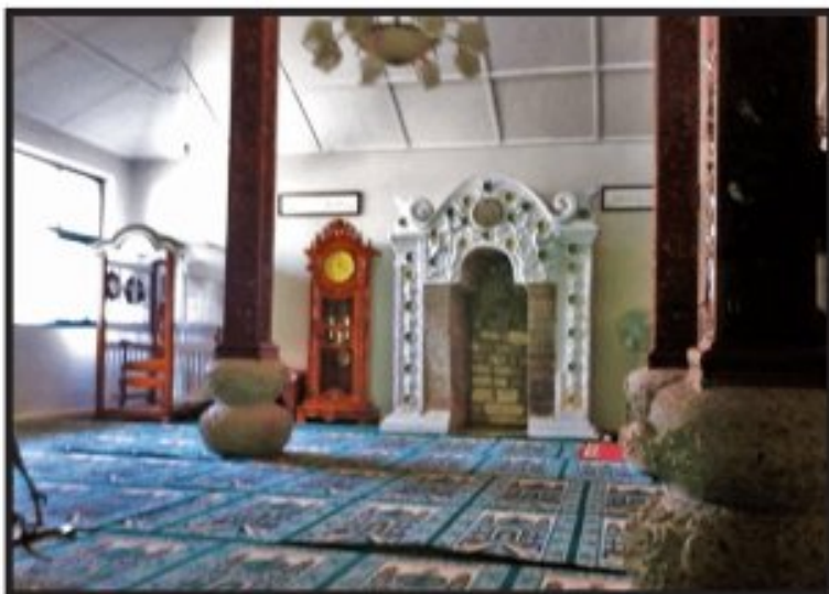
Gambar. 3 Masjid Sunan Muria Dawe Kudus

Lintasan sejarah keagamaan Kota Kudus tentu tidak bisa dilepaskan dari wali yang telah dikuburkan di Kota Santri ini. Sebagaimana di kawasan Kauman Menara Kudus bertempat Makam Sunan Kudus dan Masjid Menara, selanjutnya menetap di dataran atas Bukit Muria tepatnya di Desa Colo Makam Sunan Muria atau lebih dikenal dengan Raden Said. Tepat di pelataran depan dari makam ini terdapat Masjid Bersejarah Sunan Muria sebagai tempat beliau beribadah dan berdakwah. Secara administratif masjid ini tercatat pada website Direktorat Urusan Agama Islam dan Pembinaan Syariah Direktorat Jenderal Bimbingan Masyarakat Islam Kementerian Agama Republik Indonesia dengan alamat virtual http://www.simas.kemenag.go.id/ pada Nomor Identitas Masjid: 01.5.14.19.09.000097 beralamat di Colo Dawe Kudus.