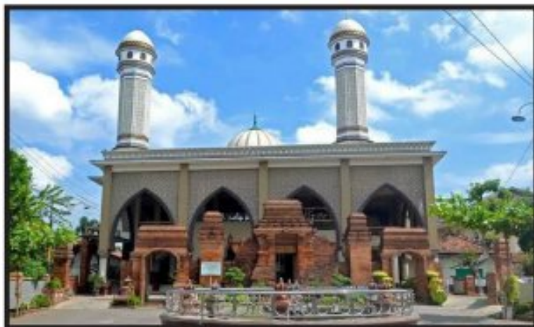
Gambar. 4 Masjid Wali Loram Kulon Jati Kudus

Masjid Wali didirikan oleh oleh Sultan Hadlirin, suami penguasa Jepara Ratu Kalinyamat. 4 Bentang sejarah berdirinya Masjid Wali Loram Kulon ini tidak bisa dilepaskan dari proses penyebaran Islam di Kota Kudus. Arsitektur masjid ini juga menjadi sebuah penanda hakiki bahwa ditinjau aspek teori difusi dalam kebudayaan, representasi Gapura Padureksan di bagian depan masjid mengikuti arsitektural Masjid Menara Kudus dengan bangunan menara yang menyerupai Candi Bentar peninggalan dari Kerajaan Majapahit di Jawa Timur. Masjid Wali Loram Kulo tercatat dalam website Direktorat Urusan Agama Islam dan Pembinaan Syariah Direktorat Jenderal Bimbingan Masyarakat Islam Kementerian Agama Republik Indonesia dengan alamat virtual http://www.simas.kemenag.go.id/ pada Nomor Identitas Masjid: 01.4.14.19.03.000047 beralamat di Desa Loram Kulon RT 07 RW 04 Jati Kudus.