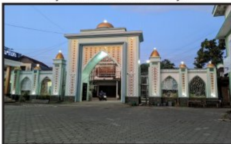
Masjid Besar Al-Ma'wa Kecamatan Mejobo