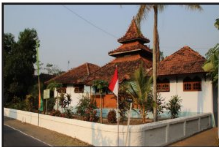
Masjid Baitul Aziz Hadiwarno Kudus