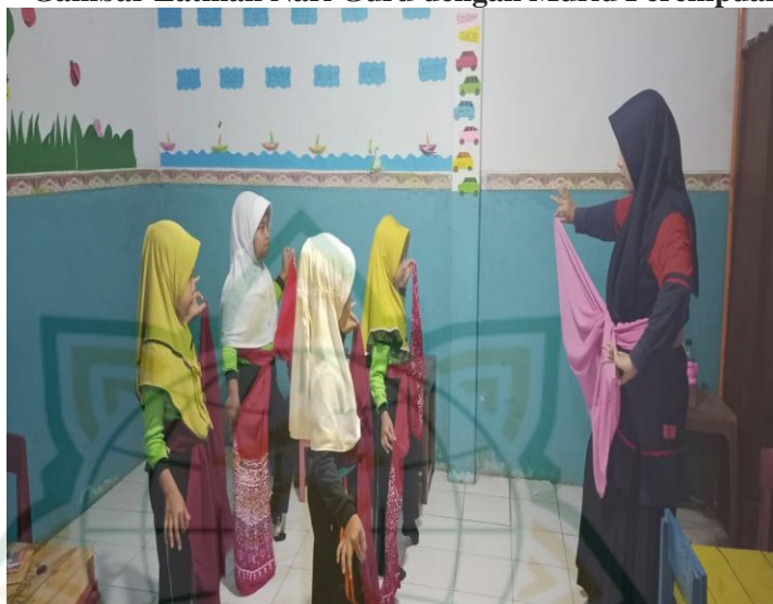
Gambar 4.3 Gambar Latihan Nari Guru dengan Murid Perempuan

Kegiatan ini terdiri dari pembukaan, inti, dan penutup. Berikut adalah penjelasannya: