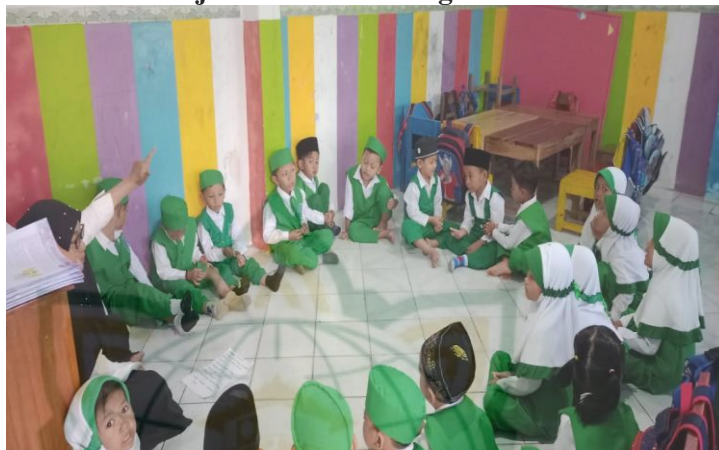
Gambar 4.4 Menjelaskan Materi Kegiatan