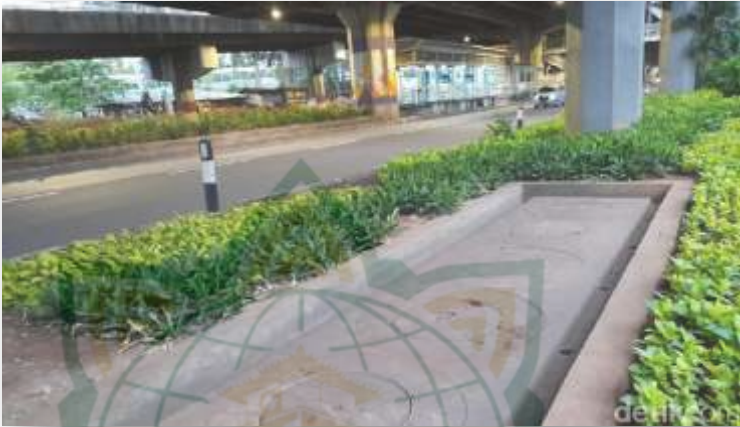
Gambar 4.7 Penampakan Sumur Resapan yang sudah jadi dibangun di Kawasan Cempaka Putih Jakarta Pusat 35

banyak pula air yang menyerap ditnah sehingga terjadi konservasi air. 34