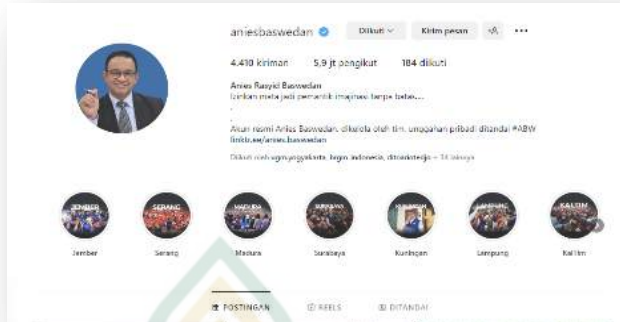
Gambar 4.18 Akun Instagram Resmi Anies Baswedan 77