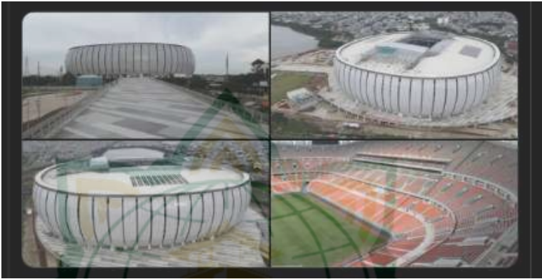
Gambar 4.4 Penampakan Stadion JIS dari berbagai sudut 16

warga Kampung Bayam agar lebih kreatif sehingga bisa menumbuhkan ekonomi baru setelah meninggalkan tempat yang kini telah dibangun Stadion JIS. 15