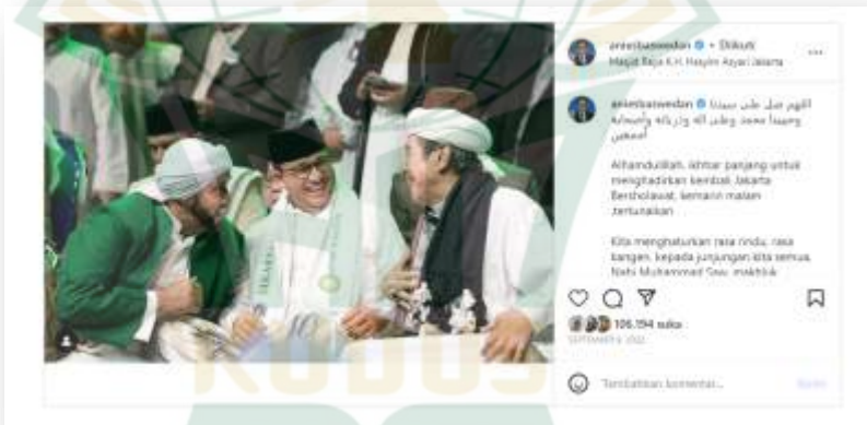
Gambar 4.21 Postingan Instagram Anies Baswedan beliau sedang di Acara Pengajian di Masjid Raya KH Hasyim Asy'ari Jakarta

Pada keagamisannya Pak Anies Baswedan beberapa kali diundang khusus dan dipercayai untuk mengisi acara atau berpidato diatas panggung. Salah satunya ialah pada tanggal 7 april 2022 beliau mendapatkan undangan khusus dari kampus UGM (Universitas Gadjah Mada) untuk mengisi ceramah tarawih di Masjid UGM. Pembahasan yang digagas oleh beliau mengenai Islam dan Perkotaan, Tantangan di Kota Jakarta lalu juga Memotivasi Mahasiswa UGM dengan gagasan yang disampaikan oleh beliau diharapkan bermanfaat dan menambah wawasan yang luas bagi Mahasiswa UGM khususnya. 82