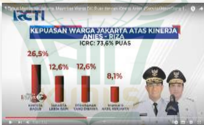
Gambar 4.12 Terkait Hasil Survey Kepemimpinan Gubernur DKI Jakarta Anies Baswedan Menurut Lembaga Survei ICRC 61

Pada tingkat kinerja lain selain pembangunan ada juga tingkat kepuasan masyarakat terhadap kinerja Anies pada aspek penanganan banjir di DKI Jakarta. setelah dilakukan berbagai Upaya dalam solusi untuk menangani bencana banjir seperti mengeruk sungai agar tidak terjadi hambatan pada aliran air, ada juga pembuatan sumur resapan untuk mempercepat surutnya air dimusim hujan agar tidak terjadi banjir dan juga pengelolaan taman atau penghijauan untuk menyeimbangkan kondisi tropis di Jakarta supaya mengurangi resiko banjir dengan harapan air diserap oleh puluhan tanaman yang berada ditaman Kota Jakarta. mengenai kinerja dalam penanganan banjir tersebut Gubernur DKI Jakarta. pada penilaian terhadap kepuasan masyarakat Jakarta terhadap penanganan banjir oleh Anies Baswedan sebanyak 59,5% menurut Lembaga Survei ICRC (Ide Cipta Research and Consulting).