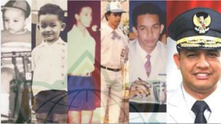
Gambar 4.17 Foto Anies Baswedan dari masa ke masa hingga menjadi Gubernur DKI Jakarta 72

Indonesia, menjadikan Pak Anies terdidik menjadi seorang pemimpin dimasa sekarang ini. 71