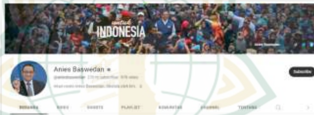
Gambar 4.19 Akun Official Youtube Resmi Anies Baswedan 78