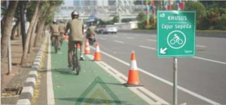
Gambar 4.9 Penampakan Jalan Sepeda di Kota Jakarta 46

Pada proses pembangunannya yang ditargetkan selesai di tahun 2022 ini menuai beberapa polemik. Polemik tersebut antara lain mulai dari kebesaran anggaran lalu di balikkannya lagi anggaran atau diperkecil hingga pro dan kontra karena menimbulkan ruas jalan kendaraan umum atau mobil dan motor semakin kecil sehingga menimbulkan kemacetan. Namun pro dan kontra itu sanggup dilewati sehingga tetap tercipta dan tetap terjaln pembangunan jalur sepeda oleh pemprov DKI Jakarta melalui Dinas Perhubungan Jakarta pada tahun 2022 yang beranggarkan sebesar Rp 7,6 Triliun dan telah disetujui oleh Komisi B DPRD DKI Jakarta. 47