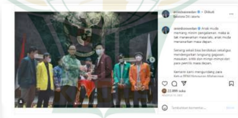
Gambar 4.16 Postingan Akun Instagram Anies Baswedan dalam Acara Diskusi Pemprov DKI Jakarta bersama BEM se-DKI Jakarta

Pada dasarnya Pak Anies Baswedan suka merangkul Anak Muda untuk dimasukkan atau diikutsertakan dalam menjalankan kebijakannya. Seperti pada tanggal 10 Agustus 2022 beliau mengadakan diskusi bersama segenap pengurus Badan Eksekutif Mahasiswa (BEM) se-DKI Raya, acara tersebut guna memberi masukan, kritik, saran serta gagasan maupun ide untuk kemajuan Kota Jakarta menuju Kota Global sesuai kebijakan Pak Anies Baswedan dalam misinya untuk menjadikan Kota Jakarta sebagai Kota Global 68 . Mengenai acara tersebut Pak Anies Baswedan memberikan pesan menyentuh “Anak Muda memang minim pengalaman maka ia tak menawarkan masa lalu, anak muda menawarkan masa depan.” Dari pesan tersebut Anies berharap Anak Muda termotivasi dan ikut andil dalam kebijakannya untuk kemajuan Kota Jakarta. 69