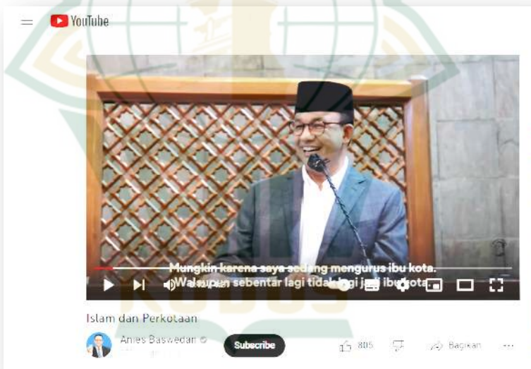
Gambar 4.14 Screenshot Akun Youtube Anies Baswedan saat Dirinya memberikan Ceramah di Masjid Kampus UGM 64

Pada pernyataan tersebut Anies kerap kali memberi wejangan kepada Anak Muda Jakarta maupun Anak Muda Indonesia. Pemberian motivasi atau wejangan kepada Anak