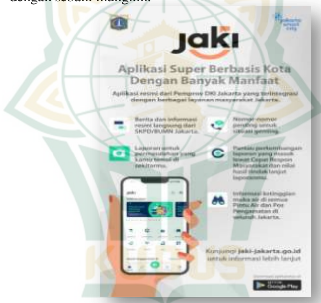
Gambar 4.11 Pak Anies Baswedan membuka Festival Batavia Kota Tua di Kawasan Kota Tua Batavia 58

Gubernur DKI Jakarta mengharapkan Aplikasi JAKI digunakan dan dimanfaatkan sebaik mungkin, aplikasi tersebut diluncurkan pada pertengahan tahun 2019 secara resmi oleh Gubernur DKI Jakarta Anies Baswedan. Aplikasi JAKI juga diharapkan sebagai wadah komunikasi antara masyarakat Jakarta dengan Pemerintah Kota Jakarta dalam pengembangan Kota Jakarta sehingga tercipta kerja sama yang bagus. Aplikasi JAKI juga bisa menjadikan alat promosi atau memperkenalkan kepada masyarakat luas untuk UMKM, Seni dan Budaya serta PKL yang ada di Kota Jakarta secara online, diharapkan fitur – fitur yang ada di Aplikasi JAKI digunakan serta dimanfaatkan dengan sebaik mungkin. 57