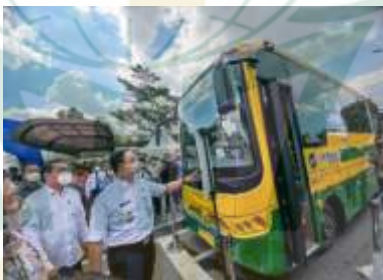
Gambar 4.5 : Anies Baswedan hadir dalam acara Launching Transportasi yang dikelola oleh PT JakLingko Indonesia 26

Melalui program JakLingko Anies Baswedan menyakini bahwa yang tadinya tidak keurus menjadi sangat keurus. Seperti halnya Angkutan umum yang dulunya terkenal kumuh dan banyak perampok atau copet serta mesin yang tidak terawat, setelah dibina dan berada dibawah naungan PT JakLingko Indonesia menjadi bersih, terawat, crew yang sudah terdaftar resmi di PT Jaklingko Indonesia. Dari sisi itulah menurut Pak Anies angkutan umum harus menjadi prioritas utama oleh masyarakat Jakarta dalam berpergian sehingga masyarakat dengan nyaman, aman dan tentram karena keselamatannya lebih terjamin dibawah naungan PT Jaklingko Indonesia. 25