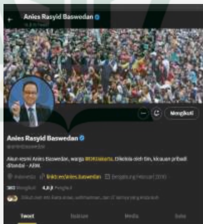
Gambar 4.20 Akun Resmi Twitter Anies Baswedan 79