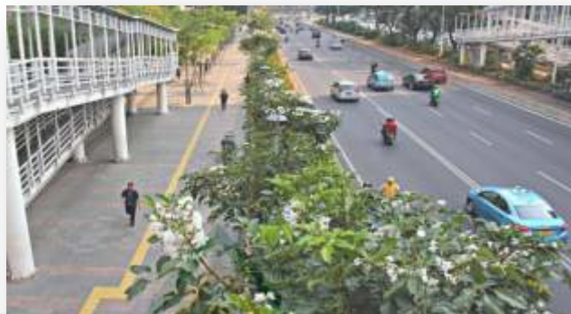
Gambar 4.6 Trotoar Kota Jakarta yang Sudah Selesai Proyek Pekerjaannya 32

Mengenai sisi baik dari pelebaran trotoar menurut Pak Anies Baswedan. Pak Anies memberikan penjelasan mengenai dibangunnya proyek pelebaran trotoar yaitu salah satunya adalah mengedepankan ciri khasnya kota modern yang trotoarnya dibuat senyaman dan seaman mungkin bagi pejalan kaki serta memudahkan dalam akses untuk menaiki transportasi umum karena telah dikonsepsi menjadi kota yang modern. Sehingga Pak Anies Baswedan dengan kebijakannya merevitalisasi trotoar Kota Jakarta dapat menjadikan Kota Jakarta sebagai Kota Global (Kota Modern). 33