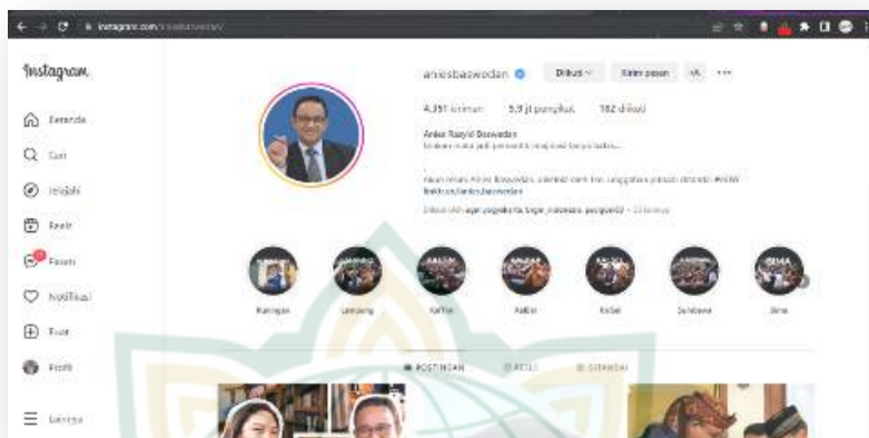
Gambar 4.2 Akun Instagram Anies Baswedan

Pada laman akun Instagram Anies Baswedan memiliki sejumlah pengikut sebanyak 5,9 juta pengikut dan 4.351 postingan atau kiriman di feed instagramnya, tentu pengikut Anies Baswedan di Instagram lebih banyak dari pada pengikutnya di twitter. Pada akun instagramnya Anies menulis bio “Izinkan mata jadi pemantik imajinasi tanpa batas” . Akun tersebut juga dikelola oleh tim media dan unggahan pribadi oleh bapak Anies Baswedan ditandai dengan tagar #ABW.