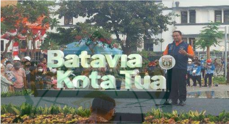
Gambar 4.10 Pak Anies Baswedan membuka Festival Batavia Kota Tua di Kawasan Kota Tua Batavia 52

BUMN dan TNI bekerja sama untuk merawat serta merevitalisasi Kawasan yang berluas 600 hektar tersebut untuk mendukung penuh kebijakan yang di ambil oleh Anies Baswedan selaku Gubernur DKI Jakarta. 51