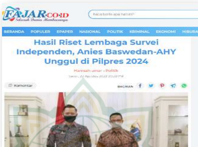
Gambar 4.23 Berita dari laman Fajar.co.id yang menjabarkan tentang Lembaga Survei terhadap Anies Baswedan pada Pilpres 2024 mendatang 92