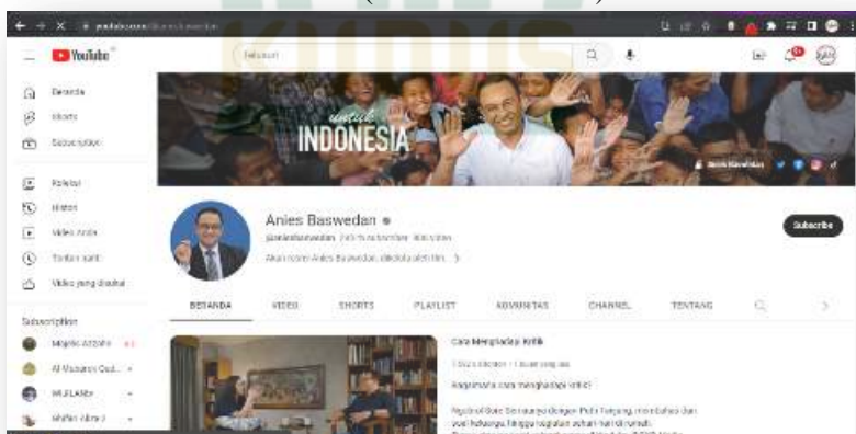
Gambar 4.3 Akun Youtube Anies Baswedan