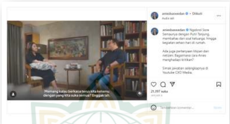
Gambar 4.22 Postingan Instagram Anies Baswedan sedang berdiskusi dengan Anak Muda Bernama Putri Tanjung 85

Pada pola pikirnya yang tinggi serta wawasan yang luas Adapun Pak Anies Baswedan sering berdiskusi dengan Anak Muda. Salah satunya pada postingannya di akun instagram resmi Anies Baswedan yang berjudul “ngobrol sore semauya dengan putri tanjong” di upload pada tanggal 06 January 2022 tersebut membahas mengenai cara menghadapi kritik ala Pak Anies. Dalam pembahasan tersebut Anies menyimpulkan bahwasanya melalui kritik yang disampaikan oleh orang - orang kepada diri kita ialah komen - komen yang diberikan kepada kita itu sebetulnya kesempatan untuk improve memperbaiki diri, pesan yang disampaikan oleh beliau sangatlah dengan perasaan yang tenang dan sangat detail dengan pola pikirnya sehingga dapat memecahkan kritik yang diberikan oleh seseorang kepada dirinya. 86