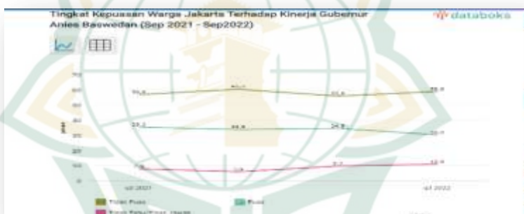
Gambar 4.13 Hasil Survei menurut Lembaga Nusantara Strategic Network (NSN) terhadap kepuasan masyarakat pada hasil kinerja Anies Baswedan 62

Pada postingan di Akun youtube Seputar News memaparkan hasil survei pada tingkat kepuasan masyarakat terhadap kinerja Anies Baswedan selama menjabat sebagai Gubernur DKI Jakarta menurut Lembaga Survei ICRC. Survei tersebut juga tidak hanya dengan kata puas karena hasil pembangunannya saja namun dibagi menjadi beberapa deskripsi yaitu ada kinerja bagus dengan nilai kepuasan 26,5%, Jakarta lebih rapi sebesar 12,6%, perubahan yang dibawa bernilai 12,6%, terbukti hasilnya dengan nilai 8,1% dengan hasil bulat sebesar 73,6 masyarakat Jakarta merasa puas terhadap Anies Baswedan. tentu beberapa deskripsi tersebut meliputi hasil pembangunan lalu manfaatnya, tujuannya dan juga dampak perubahan terhadap Kota Jakarta menuju Kota Global.