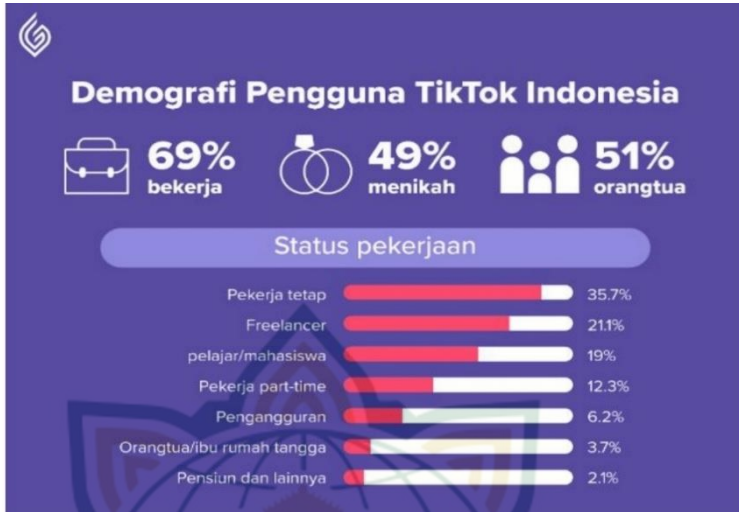
4.2 gambar pengguna tiktok