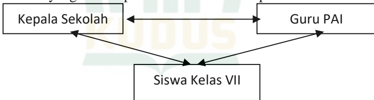
Gambar 3.1 Trianggulasi Sumber

Triangulasi sumber yang dilakukan peneliti untuk menguji kredibilitas data dilakukan dengan cara mengecek data yang telah diperoleh melalui beberapa sumber: