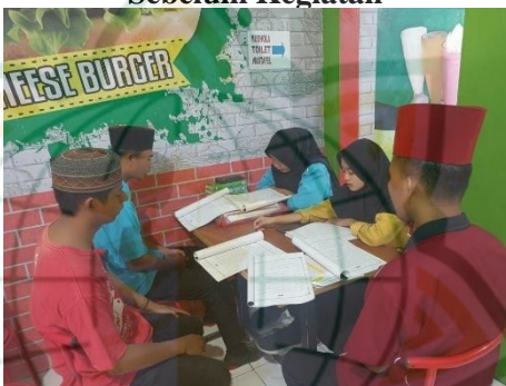
Gambar 4. 4 Karyawan Membaca Al-Qur'an Sebelum Kegiatan

Ngaji atau membaca al-qur'an merupakan kegiatan yang harus dilakukan oleh karyawan sebelum melaksanakan kegiatan kerja. Yang dimana mengaji ini dilakukan setiap pagi pukul 08.00-08.30 setiap hari. Para karyawan diharuskan bisa membaca al-qur'an agar mendapatkan keberkahan dalam kegiatan yang dijalannya. Jika ada karyawan yang belum bisa membaca al-Qur'an maka dia harus meminta bantuan kepada karyawan yang sudah bisa membaca Al-Qur'an, baik kepada senior maupun karyawan baru yang sudah lancar dalam membaca Al-Qur'an