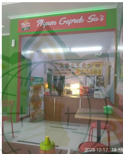
Gambar 4. 3 Keadaan Rumah Makan Saat Waktu Jama'ah sholat Isya'

Sholat jama'ah diwajibkan kepada para karyawan laki-laki rumah makan ayam geprek sa'i. Hal tersebut menunjukkan bahwa sesibuk apapun dalam kegiatan, kita sebagai muslim diharuskan tidak lupa dengan sholat dan mengingat Allah SWT. Karena sejatinya manusia diciptakan hanya untuk beribadah kepada Allah. Jika suatu pekerjaan disandingkan dengan ibadah maka akan diperoleh sebuah keberkahan di dunia dan di akhirat, sebagai bekal di hari kiamat kelak. Gambar diatas merupakan gambaran dimana para karyawan melakukan sholat jama'ah isya' dan meninggalkan tempat pelayanan untuk sholat jama'ah bersama.