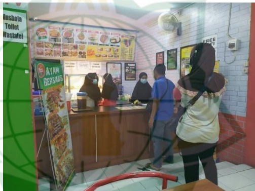
Gambar 4. 6 Antrian Di Rumah Makan Ayam Geprek Sa'i

Di setiap bisnis sikap adil harus diterapkan, karena dengan adanya keadilan maka para konsumen juga merasakan dampak baiknya, yaitu tidak ada rasa diskriminasi terhadap pelanggan. Rumah makan ayam geprek sa'i tidak membeda-bedakan dalam hal pelayanan. Jadi pelayanan yang diberikan sesuai dengan urutan dimana yang datang duluan akan dilayani.