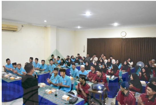
Gambar 4. 5 Training Para Karyawan Baru untuk menjelaskan sistem kerja

Sedangkan keilmuan secara umum yaitu adanya suatu training yang dilakukan oleh rumah makan ayam geprek sa'i rembang kepada karyawannya yang Baru. Jadi setiap orang yang melamar menjadi karyawan rumah makan ayam geprek sa'i pertama akan diwajibkan training tiga bulan terlebih dahulu. yang dimana tujuan training itu untuk mengajari dan melatih karyawan baru agar berpengalaman dalam mengolah makanan dan memberikan pelayanan.