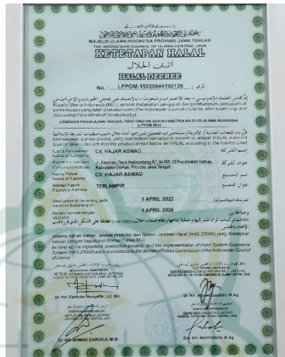
Gambar 4. 9 Sertifikat Halal Dari MUI

Dari hasil wawancara diatas dapat diketahui bahwa penerapan prinsip halal dan haram diterapkan dengan baik. Para karyawan dalam memasak juga harus sesuai standar oprasional prosedur jadi para karyawan tidak boleh asal-asalan dalam memasak. Karena jika memasak dengan se enakny maka akan menghancurkan cita rasa yang khas ayam geprek sa’i.