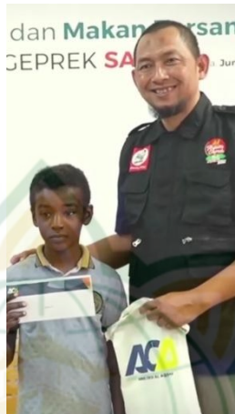
Gambar 4. 7 Bentuk Shadaqah Yang Dilakukan Rumah Makan Ayam Geprek Sai Rembang

Bentuk shodaqah yang dilakukan oleh rumah makan ini yaitu memberikan bantuan kepada anak-anak dan orang miskin. Dan dalam pemberian shadaqah tersebut tidak ada paksaan dari pihak manapun, artinya rumah makan ayam geprek sa'i bisa melakukan shadaqah kapanpun yang perusahaan inginkan.