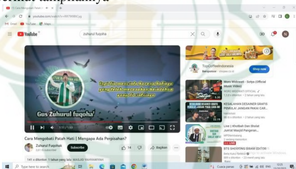
Gambar 4.3 Kegiatan Dakwah

Channel Youtube Ustadz zuhurul fuqohak berbeda dan juga inspiratif dari channel dakwah yang lainnya. kontennya yang begitu banyak didalam satu channel. Karena di chanel ini ada salah satu video yang membahas tentang persoalan anak muda tentang cara mengobati patah hati, berikut tampilannya