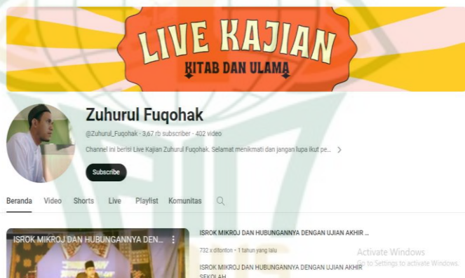
Gambar 4.1 Chanel Youtube Zuhurul Fuqohak

Chanel Ustadz Zuhurul Fuqohak di bentuk pada tanggal 4 Maret 2018 yang dibuat oleh beliau sendiri. Chanel ini dibuat untuk mengabadikan pengajian yang sering beliau lakukan di dalam pesantren dan ketika ada undangan. Berdakwah dilingkungan sekitar maupun luar kota sebelum merambah ke dunia youtube. Beliau memulai berdakwah di halaman facebok berupa tulisan tulisan seiring berjalanya waktu dan meledaknya Youtube. Setelah itu barulah ustadz Zuhurul Fuqohak mencoba beralih ke dunia Youtube.