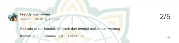
Gambar 4.4 Review Dari Tamu Hotel RedDoorz Syariah Near Menara Kudus

Dari beberapa gambar yang sudah peneliti rangkum terlihat tamu hotel yang merasa kurang puas terkait dengan pelayanan, fasilitas yang tersedia, beserta tempat lokasinya yang memang berada di tengah pemukiman warga. Setidaknya ini harus menjadi perhatian bagi pemilik hotel untuk memperbaikinya agar tamu merasa puas dan bisa merekomendasikan kepada saudara dan teman-temannya.