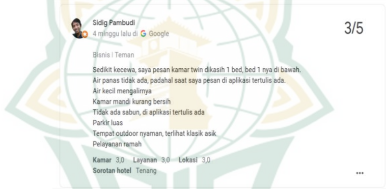
Gambar. 4.1 Review Dari Tamu Hotel RedDoorz Syariah Near Menara Kudus

Selain komentar positif tersebut nampaknya ada beberapa tamu hotel yang memberikan review kurang puas ini terlihat pada website Hotel RedDoorz Syariah Near Menara Kudus, yang peneliti rangkum pada gambar di bawah ini: