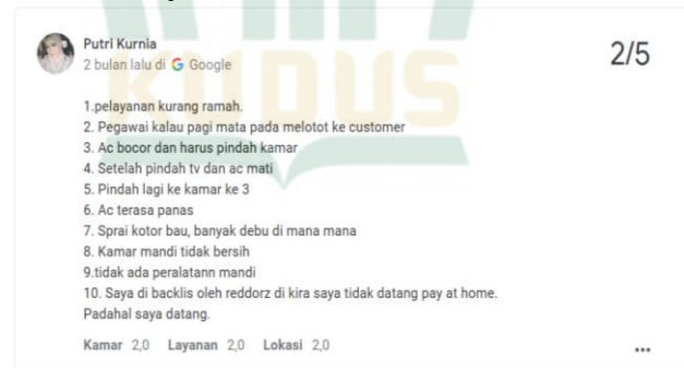
Gambar 4.2 Review Dari Tamu Hotel RedDoorz Syariah Near Menara Kudus