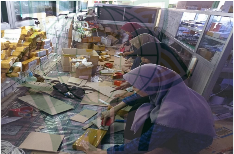
Gambar 4.4: Proses packing orderan Vape Store Ngaringan

Dengan banyaknya orderan yang masuk karyawan yang terbiasa mengambil produk sesuai dengan orderan yang tercatat dalam resi melakukan kesalahan. Untuk mengantisipasi kesalahan ini perlu dilakukan pengecekan ulang oleh karyawan lain sebagai penyortiran untuk memastikan produk yang akan dikemas dan dikirim kepada konsumen sudah benar sesuai orderan yang diinginkan. Berikut dokumentasi proses packing orderan yang akan dikirim; 118