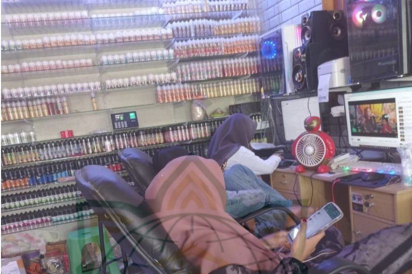
Gambar 4.1: Ruang kerja admin Vape Store Ngarinan

Dari gambar dokumentasi di atas menunjukkan ruang kerja admin masih jadi satu dengan tempat penyimpanan barang. Lokasi yang terbatas dimanfaatkan semaksimal mungkin untuk menyimpan stok yang dimiliki. Bisa dilihat produk liquid ditempatkan berada dalam rak kaca bertujuan untuk memudahkan saat mengambil barang sesuai orderan dalam jumlah yang banyak