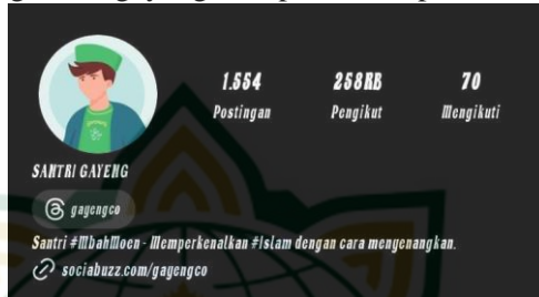
Gambar 1.2 Tampilan Profil Akun Instagram @gayengco 4

nama santri gayeng dan pengelola akun Instagram @gayengco, yang merupakan divisi media di santri gayeng. Akun Instagram @gayengco juga mengandung sumber kajian dan dakwah yang dibagikan, serta link ke barang resmi komunitas santri gayeng, yaitu #MbahMoen. Tampilan profil akun Instagram @gayengco dapat dilihat pada Gambar 1.2 .