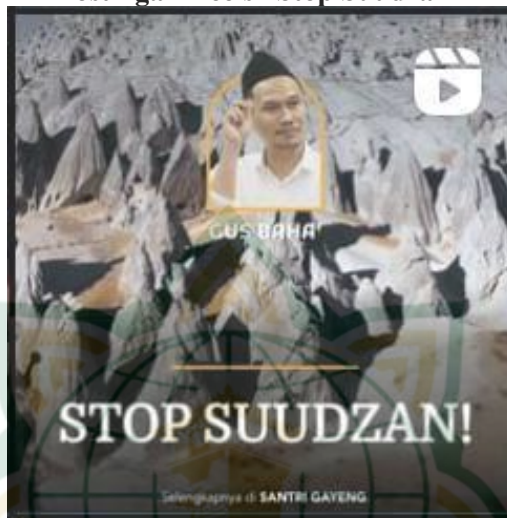
Gambar 1.4 Reels Stop Suudzan