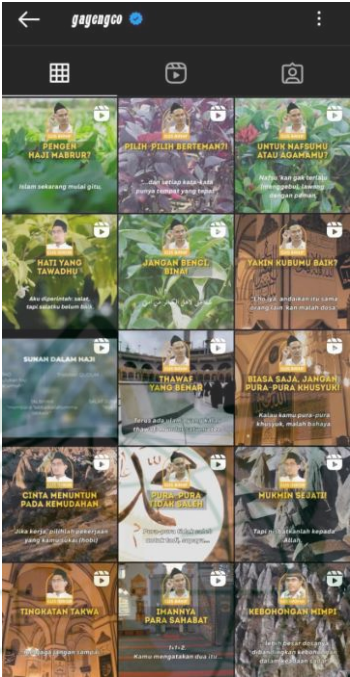
Gambar 1.3 Tampilan Postingan Instagram @gayengco