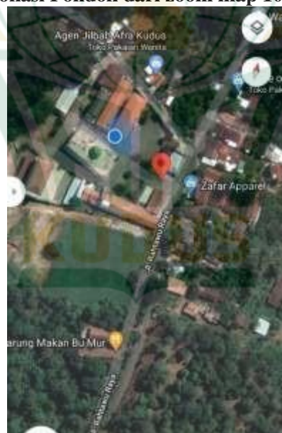
Gambar 4.4 lokasi Pondok dari zoom map 200 kaki 50 m