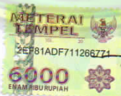
Ridwan NIM: 112040