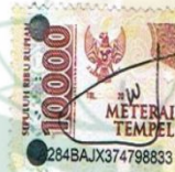
ALIF ARFIAN SYAH

Kudus, 12 September 2021 Yang menyatakan