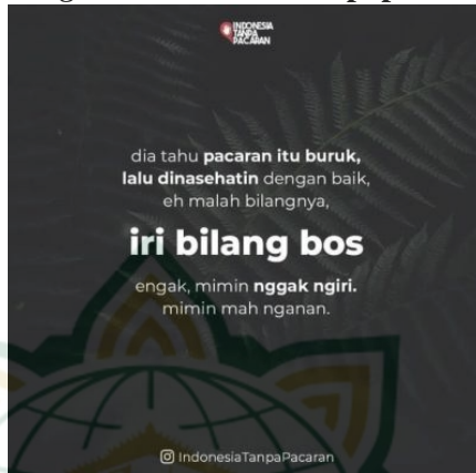
Gambar 4.3 Postingan Lelucon di Akun Instagram @indonesiatanpacaran