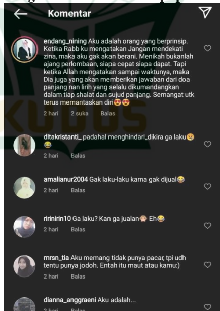
Gambar 4.8 Kolom Komentar di Akun Instagram @indonesiatanpapacaran