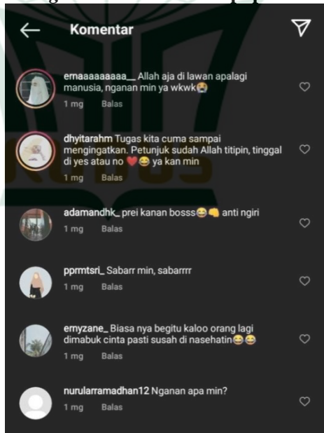
Gambar 4.4 Kolom Komentar di Akun Instagram @indonesiatanpapacaran