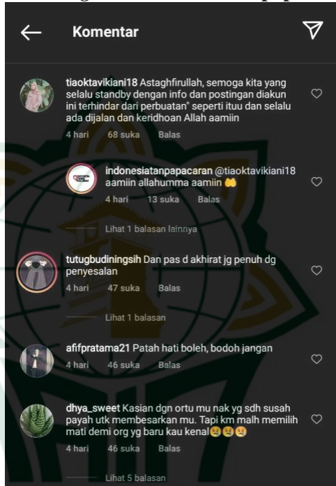
Gambar 4.2 Kolom komentar di Akun Instagram @indonesiatanpapacaran

Postingan ini mempunyai banyak respon dari masyarakat, dan dengan postingan ini juga banyak para pengikut dari akun instagram @indonesiatanpapacaran memberikan banyak komentar, baik itu komentar yang merasa kasihan, meyalahkan, dan ada juga yang menyalahkan atas perbuatannya tersebut. 12