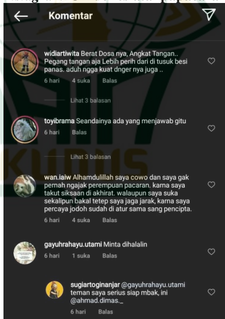
Gambar 4.6 Kolom Komentar di Akun Instagram @indonesiatanpapacaran

Postingan ini juga banyak respon dari para pengikutnya karena banyak mereka yang setuju, bahkan ada juga yang menceritakan pengalamannya yang tidak pernah