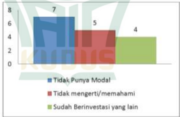
Gambar 4.3 Alasan Tidak Berinvestasi Di Pasar Modal

Berdasarkan tabel 4.5 bahwasanya 57 responden berkeinginan berinvestasi dipasar modal, sedangkan 16 responden lainnya menyatakan kepada peneliti belum berkeinginan untuk berinvestasi dipasar modal. 4