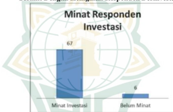
Gambar 4.1 Terkait Dengan Keinginan Responden Berinvestasi

Dalam gambar 4,1 ini menyatakan bahwa hasil yang didapatkan oleh peneliti adalah: bahwasanya 67 responden sudah mempunyai keinginan untuk berinvestasi, dan 6 responden menyatakan belum mempunyai keinginan untuk berinvestasi. 3