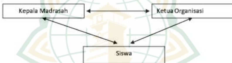
Gambar 3.1 Triangulasi Sumber

Triangulasi sumber yang dilakukan peneliti untuk menguji kredibilitas data dilakukan dengan cara mengecek data yang telah diperoleh melalui beberapa sumber: