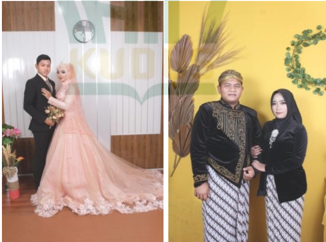
Gambar 4.2 Pakaian Saat Foto Prewedding

“Menurut saya dalam memilih konsep foto prewedding itu sendiri seorang klien / mempelai pengantin bebas memilih konsep tersebut. Biasanya konsepnya seperti kasual, bebas dan lain sebagainya.” 48