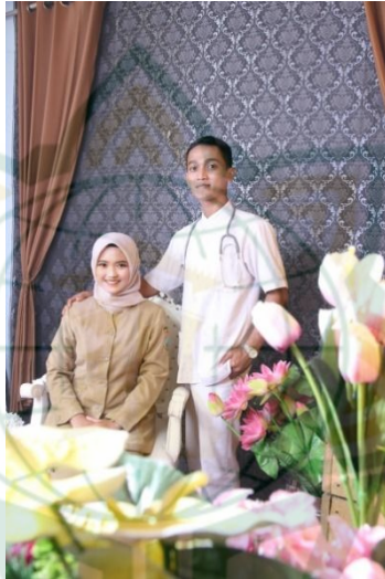
Gambar 4.5 Solusi 2 Foto Prewedding

Pose dalam adegan calon mempelai pengantin diatas ini yang menunjukkan bahwa kedua calon pengantin tersebut tengah mengambil foto dengan konsep berpakaian seragam pekerjaannya dan mereka berpose tanpa saling berpegangan tangan melainkan berpegangan dipundaknya dan menatap ke depan.