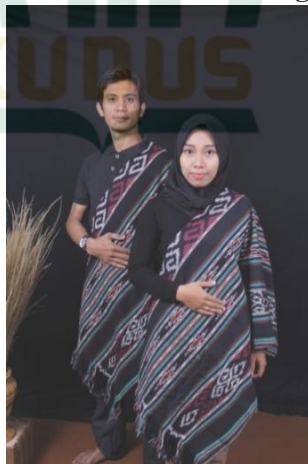
Gambar 4.4 Solusi 1 Foto Prewedding

Dalam memberikan solusi contoh foto prewedding, maka penulis dapat memberikan beberapa contoh solusi yang bisa dijadikan referensi yang baik bagi mereka yang akan melaksanakan pemotretan foto prewedding. Berikut ini beberapa contoh foto prewedding tersebut : 59