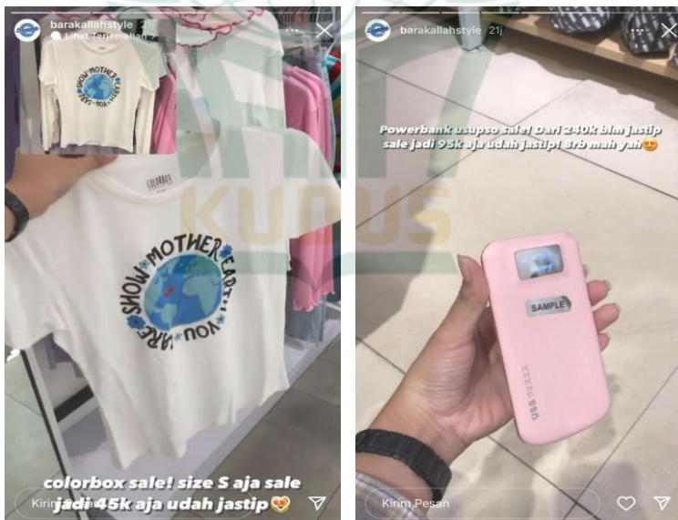
Gambar 4. 2 Produk Promo

Beberapa barang bermerek yang ditawarkan oleh akun instagram @barakallahstyle diatas merupakan produk original berasal dari store produk tersebut dijual. Pemilik akun instagram @barakallahstyle hanya mempromosikan produk-produk tersebut dengan mengambil foto atau video detail produk kemudian mengunggahnya di akun instagram sebagai media bisnis jasa titip online. Akun instagram @barakallahstyle tidak hanya menawarkan produk-produk brand mall tersebut pada saat harga normal saja namun juga selalu menginformasikan kepada konsumen apabila produk-produk yang ditawarkan sedang ada promo, penurunan harga hingga kenaikan harga.