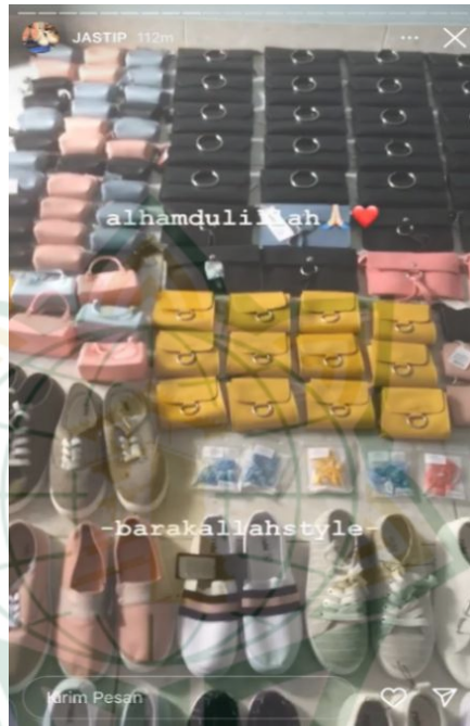
Gambar 4. 7 Testimoni Jasa Titip

meningkat setiap minggunya. Terlihat dari unggahan video di instastory akun instagram @barakallahstyle.