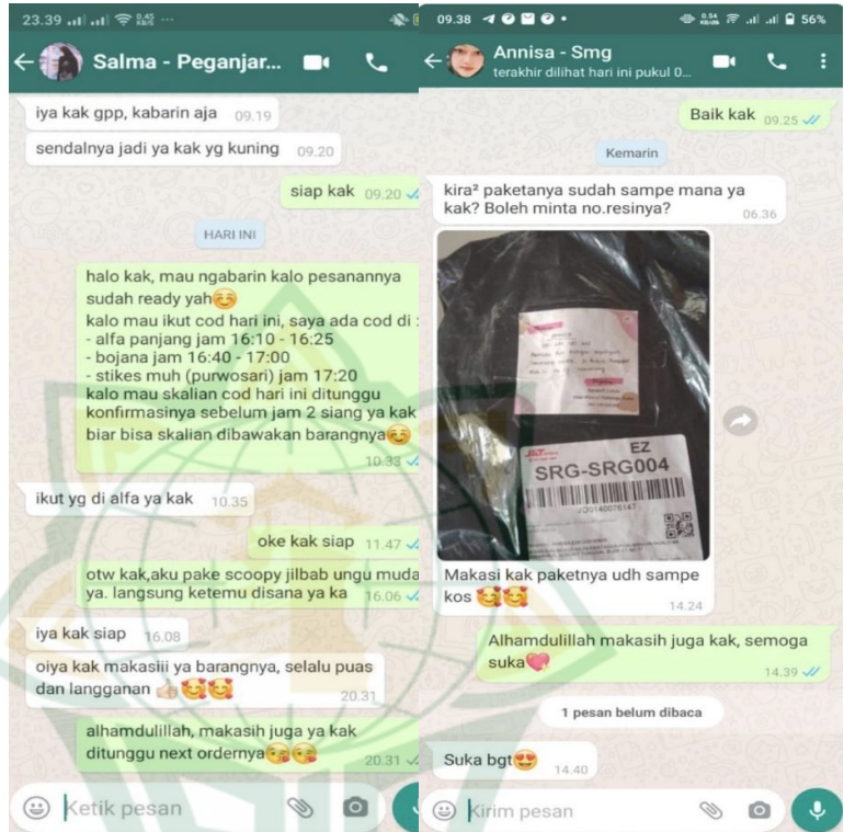
Gambar 4. 5 Pengiriman Barang Titipan

Selain melakukan wawancara dengan pemilik akun instagram @barakallahstyle, penulis juga melakukan wawancara kepada konsumen layanan jasa titip online dari akun instagram @barakallahstyle. Beberapa konsumen yang penulis wawancara diantaranya: