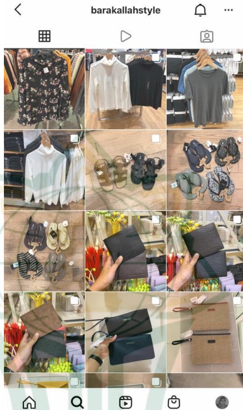
Gambar 4. 4 Produk yang Ditawarkan

Pemilik akun instagram @barakallahstyle memaparkan alur transaksi layanan jasa titip online untuk mempermudah komunikasi dengan calon konsumen. Konsumen yang berminat untuk menip beli produk yang telah ditawarkan akun instagram @barakallahstyle, penitip harus mematuhi prosedur yang berlaku untuk menitip beli barang. Konsumen atau penitip yang ingin menitip beli barang yang ditawarkan dapat menghubungi nomor WhatsApp yang tertera di profil akun instagram @barakallahstyle dengan mengisi format order berikut: