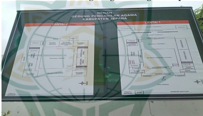
Gambar 4.2 Lokasi Denah Gedung Pengadilan Agama Jepara

Wilayah kabupaten jepara terdiri dari 16 kecamatan yang dibagi lagi atas sejumlah 183 Desa dan 11 kelurahan dengan jumlah penduduk 1.200.000 (satu juta dua ratus ribu) jiwa. Adapun jumlah perkara yang ditangani setiap tahunnya berkisar 2.500-an (dua ribu lima ratus) perkara. Jumlah pegawai pengadilan agama Jepara saat ini adalah 21 pegawai negeri dan 12 honorer. Yang terdiri dari 4 Hakim, dan 17 pegawai negeri dan 12 pegawai honorer.