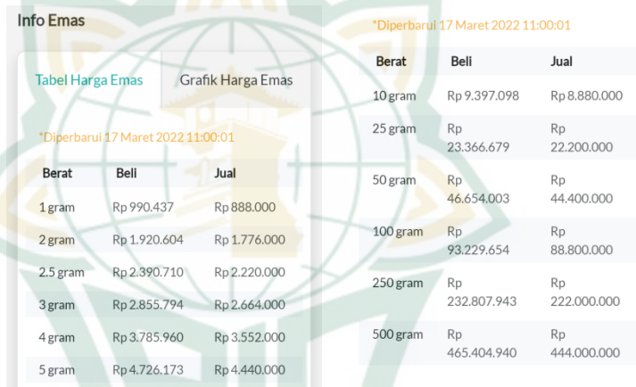
Gambar 4.4 : kurs jual beli emas

Harga merupakan pengetahuan dasar tentang kapan saat yang tepat untuk kita membeli dan menjual emas. Apabila harga emas rendah, itu adalah saat yang tepat untuk kita membeli emas. biasanya masyarakat yang sering memantau pasar sudah tahu kapan saat membeli emas. seperti yang dikatakan pak danang tri bahwa harga emas berubah ubah tapi tetap stabil pada tahun ke tahun. Jadi dalam berinvestasi emas merupakan investasi yang aman.