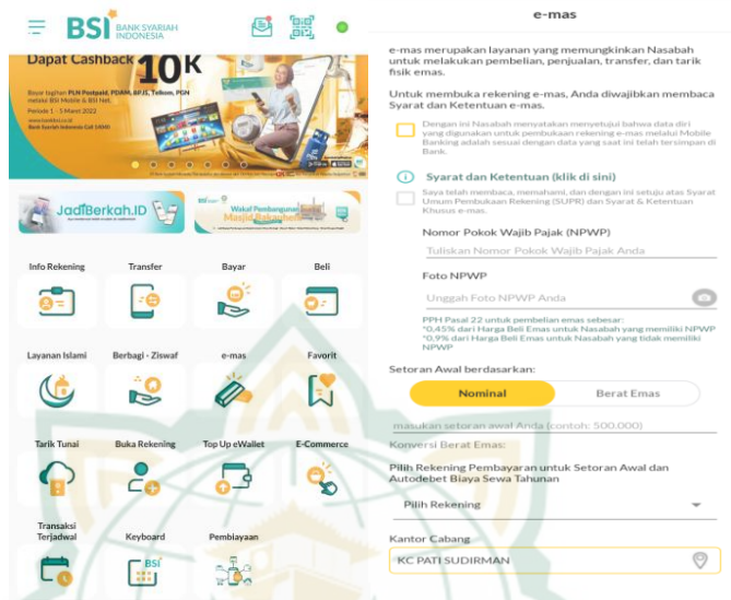
Gambar 4.2 Fitur E-Mas pada BSI Mobile