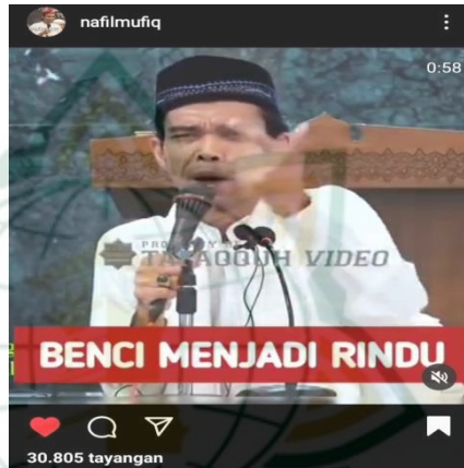
Gambar 4.18 screenshot vidgram @nafilmufiq

Takut, iri, benci, marah, rindu, cinta letaknya didalam hati. Makanya kita tidak boleh benci. Haii gadis-gadis coba tanya anak lajang itu, “ccuuihh,,,,. Najis aku tengok kau.” Tiba-tiba di sukses, selesai S1 dapat S2 ke Australia, pulang dia, bisnismen, PNS, pegawai BUMN, punya perusahaan, kaya akhirnya rubah enci jadi rindu haaaa kalau benci, benci sewajarnya saja. Kenapa,,? Boleh jadi suatu saat dia akan menjadi kekasihmu. Karena benci dan rindu tipis setipis kulit bawang. 21