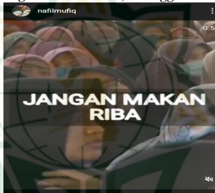
Gambar 4.10 scrensnot vidgram @nafilmufiq

Ustadz ini ada uang riba boleh nggak ustadz ?? haram..!!! kalo kita bagi dua pak ustadz? Eee ulama tidak sepakat dalam hal itu. Sekali haram tetap haram. Ustadz Shomat ngomong haram haram,, itu ustadz ada jadwalnya ceramah di bank kompensional ? terus kalo bank itu ngasih honor transfer ustadz trima ? Saya trima. Terus ustadz ambil ? iyaaa, tapi saya serahkan ke anak yatim, fakir miskin. Terus kalo dia kasih kue ? nggak saya makan. jagan dimakan karena kalo itu dimakan merubah satu risol menjadi darah, terus darahnya