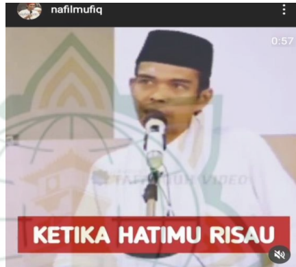
Gambar 4.7 screnshot vidgram @nafilmufiq

Hatimu risau lalu kau makan, tak akan berjumpa. Hatimu risau kau minum khomar, sabu-sabu, narkoba tak kan ketemu. Hati yang risau hanya di adukan kepada dia” Allah Swt.” Kalau sempit dunia, katakana “ya Allah tidak ada yang bisa mengusir gundah gulana. Alla dikrillah, Alla dikrillah . Ketahuilah barang siapa yang menyebut Allah, subhanallah walhamdulillah wala ilaha illallahu akbar, subhanallah wabilhamdihi, subhanallah hiladzim, astagfirullah, allahuma sholli ala sayyidina Muhammad wa ala alihi Muhammad . Lantunkan itu di lidahmu, ucapkan itu di tepi bibirmu. Tapi jangan sampai hatimu lalai. Jangan termasuk orang yang lalai ketika engkau jauh dari Allah. Ketika jauh dari kuasa Allah, pada