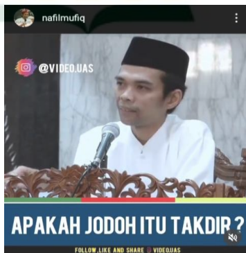
Gambar 4.3 screenshot vidgram @nafilmufiq