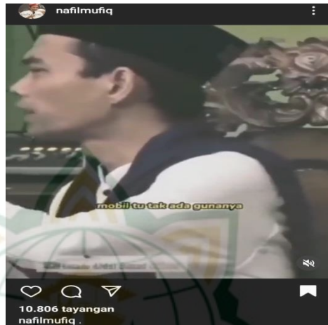
Gambar 4.22 screenshot vidgram @nafilmufiq

Setelah orang tua itu tak ada, barulah kita rasa dunia ini hampa tak ada gunanya. Duit tak ada gunanya, mobil tu tak ada gunanya, rumah tu tak ada gunanya apapun tak ada gunanya. Barulah kau cari mana kain yang pernah dia pakai dulu, mana sajadah yang dulu pernah dia pakai waktu sholat, di mana dulu dia sering duduk . bekas tempat duduknya pun bisa menghilangkan rindu, tapi setelah dia tak ada. Makanya mumpung dia masih ada ciumlah tangannya, peluklah badannya, ciumlah keningnya, kalu kau ada duit kirimlah. Siapa yang kira-kira di gaji di bayar untuk memasak dia di rumah berkirimlah, karena sampe masanya nanti duit yang banyak itu tidakada gunanya. Sebanyak apapun kau simpan tak ada rasanya lagi, hampaa..... 24