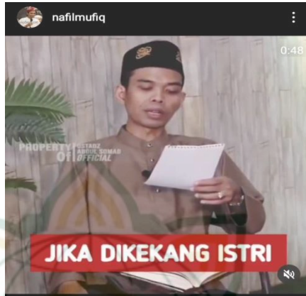
Gambar 4.21 screnshot vidgram @nafilmufiq

Saya nikah satu tahun lalu, istri saya selalu menuntut saya mempersamainya, saya kerja dibatasi, saya berteman dibatasi, bahkan dia marah ketika saya jenguk dan bantu ke dua orang tua saya di kampung, apakah istri saya ini dzalim ustadz,,? Dia tak dzalim, bapak aja yang penakut “ apa yang harus saya sampaikan ke istri saya pak ustadz?” Suruh dia ngaji, suruh dia ikut pengajian ibu-ibu di surau, di mushola abis ashar. Pesankan ke ustadz pengajian tentang hak-hak suami istri, mungkin bapak tak berani menyampaikannya, nanti ustadz menyampaikan dia. Lau kutu aamiron ahadan an yasjuda liahadin, la amartiy al mar atan tasjuda lizaujuha. Seandainya aku memerintahkan manusia boleh sujud manusia kepada manusia, pastilah ku perintahkan engkau para istri sujud kepada suami. 23