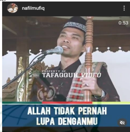
Gambar 4.20 screenshot vidgram @nafilmufiq

Dia sholat, kenapa dia sakit ? dia puasa, kenapa rizkinya tidak lancar, kalo begitu tuhan sedang lupa. Tidaakkk Allah tak pernah lupa “ ya'lamu maa baina aidiihim ” dia tahu yang ada didepan “ wa maa khalfahum ” ada dibelakang “ wa laa yuhiituna bisyai im min ilmihi illa bimaa syaa ” tidak ada satu pun yang mempunyai pengetahuan kecuali pemberian Allah Swt. Lalu kenapa Allah biarkan mereka dalam keadaan sakit ? sebenarnya di balik sakit itu ada ampunan. Ada orang yang sakit gundah gulana, susah hatinya risau bahkan duri yang menusuk di telapak kakinya. Allah sedang ingin menghapuskan dia dari segala dosa-dosanya. Sebaiknya engkau berfikir kusnudzon kepada Allah. Aku menurut prasangka hambaku. 22