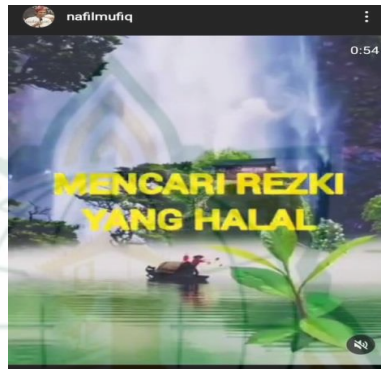
Gambar 4.11 screnshot vidgram @nafilmufiq

Mencari rizki yang halal, meninggalkan anak dan istri demi untuk memberi nafkah, menjaga diri dari riba, menjaga diri dari haram, menjaga diri dari subhat. Di tinggalkan anak yang masih kecil, istri yang memerlukan kasih sayang, ku tinggalkan kalian bukan karena hawa nafsu tapi ingin mencari yang halal. Tetesan air mata, penuh keringat dan kerinduan munajad di tengah malam di bayar Allah Swt dengan tetesan darah seorang syahid, siapa yang mati membela kehormatan hartanya, maka dia mati syahid, betapa seseorang yang susah, melarat hanya untuk menjaga diri dari subhat. Alah muliakan dia inna akromakum indallahi yang paling mulia