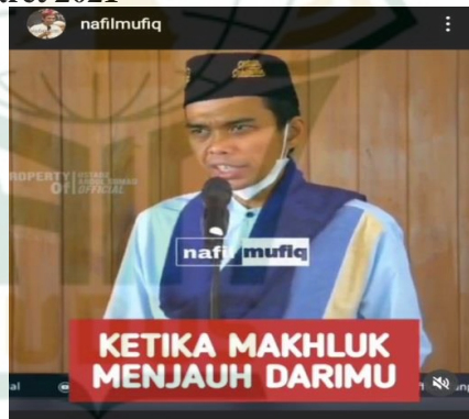
Gambar 4.4 screenshot vidgram @nafilmufiq

Jangan bersedih jika kau didustakan, jangan bersedih jika kau di bunuh karaktermu, jangan berduka cita jika tidak ada manusia yang menerimamu, karena sesungguhnya itu cara Allah menguatkan hatimu, karena dia ingin mengangkat drajatmu menempatkan di tempay yang terpuji.