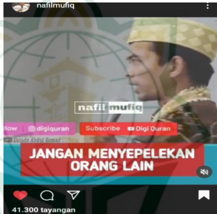
Gambar 4.15 screenshot vidgram @nafilmufiq

Tukang cuci dirumah kita jangan sepelekan mereka. Pembantu, security, supir tukang panen tapi mereka juga makhluk Allah Swt. Maka sebab itu jangan menyepelekan orang, jangan meremehkan orang. Dunia selalu berputar jangan pernah menyepelakan perbuatan baik walaupun kecil, termasuk acara hari ini bisa terselenggara karena banyaknya kelingking-kelingking orang-orang kecil dan terkabulnya doa mengetuk pintu langit karena orang-orang kecil. Makanya kalo saya ketemu dengan klining service dengan tukang pel bertemu di air port dan macam-macam tempat lalu orang menyepelekan “jangaann