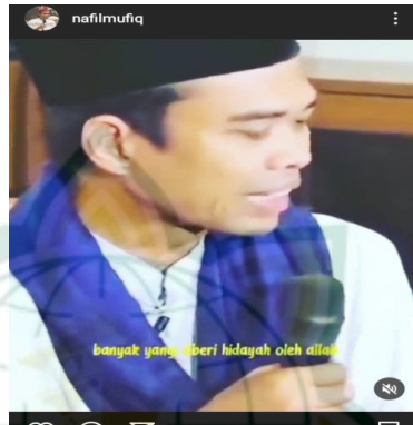
Gambar 4.8 screenshot vidgram @nafilmufiq

Jangan pernah malu merasa salah, karena malu di dunia hanya berhadapan sekejap saja, tapi malu di akhirat, berapa lama kehidupan di akhirat?? Dunia ini walaupun kita malu, sepuluh bahkan dua puluh tahun, selepas itu malu kita akan hilang karena kita mati. Tapi di akhirat kita tidak akan mati. Akhirat tidak ada matinya lagi karena mati hanya di dunia saja, di akhirat kekal abadi. Kekal abadi di surga kholidina fiha abada ataupun kekal abadi pula di neraka. Waquduhannaasu wal-hijaratu menjadi bahan bakarnya api neraka, Waquduhannaasu wal-hijaratu bahan bakar api neraka itu ada dua nas manusia hijarah batu-batu. Ada manusia yang kekal abadi dalam neraka karena dia akan menjadi kayu-kayunya neraka. Naudzubillah makanya kita selalu berdoa allahumma ajirna minannar ,