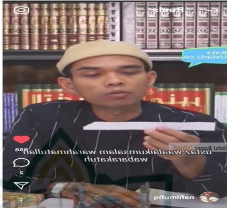
Gambar 4.19 screenshot vidgram @nafilmufiq