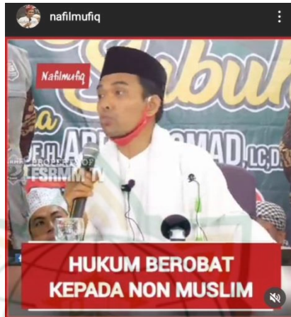
Gambar 4.13 scrensnot vidgram @nafilmufiq

Bagaimana hukumnya kalau kita berobat kepada non muslim? Kalo sudah mati semua dokter di pekan baru, tak ada lagi dokter islam. Ada lahh dokter terakhiirr di dekat simpang damai langit, begitu sampai di situ dokter itu sakaratul maut, Tak ada lagii, tinggallah satu-satunya ini dan dia orangnya amanah. Saudara kita yang non muslim, kalo yang non muslim itu tidak menusir kamu dari halaman kamu, tidak membunuh kamu tidak memusuhi agama kamu tida menyebarkan karikatur mengejek nabi kamu, dia baik dengan kamu antaa barrohum kau berbuat baik sama dia, khatub siitu illahillah bersikap adillah kepada dia. Bolehhhh... dengan syarat dan ketentuan tersebut. 16