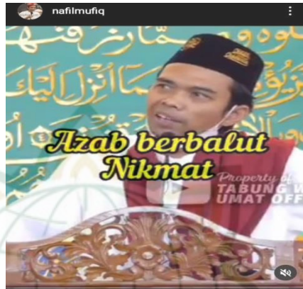
Gambar 4.12 scrensnot vidgram @nafilmufiq

Kenapa orang yang taat sholat, puasa, zakat, ngaji hidupnya penuh dengan kesakitan, penderitaan?? kenapa peminum khomar, pezina, koruptor, penipu, pembohong hidupnya tenang perutnya kenyang?. kenapa tidak ada kesusahan?? Maka sesungguhnya mereka sedang di azab Allah, azab yang lebih mengerikan dari pada penyakit, azab berbalut nikmat, istidroj namanya. Bukankah nabimu pernah berkata “Allah memberikan nikmat kepada orang-orang zalim” nabi yang berkata demikian!! Orang zalim itu di ulur dengan nikmat. Ketika Allah mengazab mereka tak sedikitpun ada lagi kesempatan mereka untuk masuk dalam surga Allah. 15