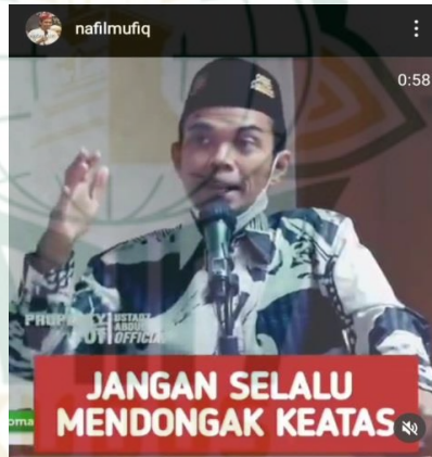
Gambar 4.5 screnshot vidgram @nafilmufiq

Kalo dalam masalah ibadah kita harus lihat keatas. Tapi kalo masalah dunia, berapa banyak orang naik mobil mewah harga dua miliar mengeluh ? kata dia “ tuhan tak adil .” kenapa ? karena kepalanya selalu melihat keatas. Melihat temannya yang naik pesawat pribadi. Tak ada harga mobil, dia nengoknya pesawat. Saya waktu