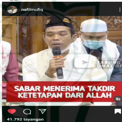
Gambar 4.6 screnshot vidgram @nafilmufiq

Sabar menerima cobaan, ujian, rumah terbakar hancur, anak meninggal terbakar, di kandung Sembilan bulan sepuluh hari disusukan dua tahun sedang lucu-luunya, meninggal dia. Apa tak berguncang dunia ini? “anak saja ustad bilang sabar, ustad tidak mengalami.” Karena tak mengalami itu lah aku bisa berceramah bilang sabar hahaha. Kalo kita yang mengalami, orang lain yang mengingatkan kita. Maka bunyi ayatnya “ watawa saubis sobri ” saling menasehati, ketika