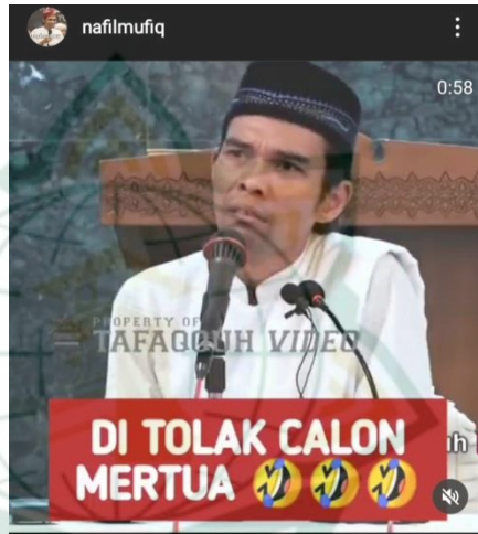
Gambar 4.17 screenshot vidgram @nafilmufiq

Datang anak lajang. “pak aku ingin meminang anak bapak.” Kau bawa apa? “Aku membawa sebongkah iman dan segebok berlian.” Pastilah di terimanya hahaha...”aku ingin anak bapak menemaniku menjelang malaikat maut menjemput pak” apa yang kau bawa? “ku pinang dengan bismillah,” pergilah kau balik haha... oleh sebab itu kalau datang ke rumahmu orang yang kau sukai baik akhlaknya, baik agamanya, sopan santu, budi bahasa trimalah dia. Hari gini masih mempermasalahkan suku..? apa kata dunia,,? Suku,,? Aku tak mau, dia bukan orang Palembang