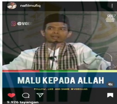
Gambar 4.9 scrensnot vidgram @nafilmufiq

Siapa yang punya kambing 40 ekor, zakatnya 1 ekor kambing. Petugas amal sudah ngitung, “ini jam 06:30 besok kita datang kita kutip dapat satu kambing.” Begitu di hitung tetap 39 ekor kambing. “ loohh ini mestinya 40” sudah saya jual satu (kata pemilik kambing). Secara fikih dia tidak bisa di tuntutan karena seumur hidup tidak pernah mencapai nisab. Tapi kalau dia di tanamkan akhlak,