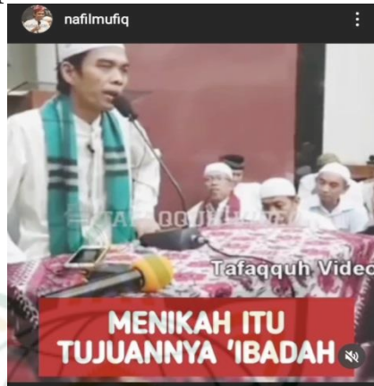
Gambar 4.14 screenshot vidgram @nafilmufiq

Menikah itu tujuannya ibadah. Kalaulah laki-laki mencari perempuan tujuannya ibadah, maka dia akan mencari perempuan yang kira-kira menolong ibadah dia. Kalaulah perempuan itu menikah tujuannya ibadah, maka dia akan menari laki-laki yang kira-kira mampu membantu ibadah dia. Jadi kalau sekarang banyak kertas yang masuk Ketika tanya jawab, ustadz bagaimana mengajak suami sholat ? nah kalau itu dari awal sudah salah setting nih hahaha,,, karena dari awal itu carilah imam yang kira-kira membimbing ibadah kita, karena tujuan diawalnya adalah ibadah. 17