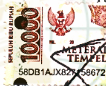
Moh Nur Faizin MP-18063